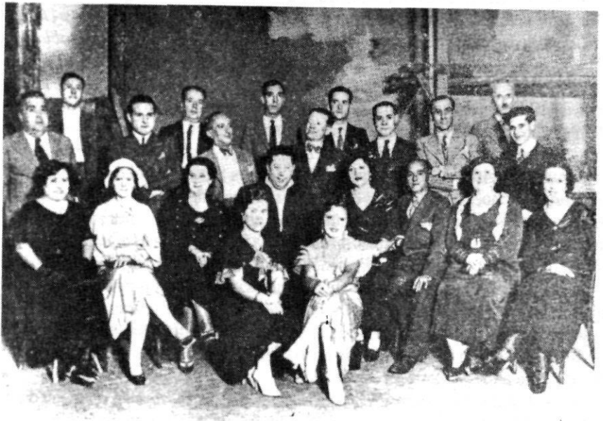
La companyia "Nostre Teatre" de València (1938)