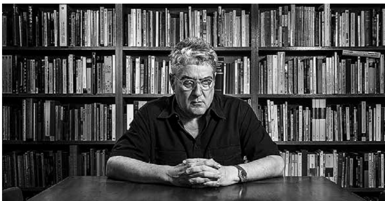
Quim Monzó (Barcelona, 1952)