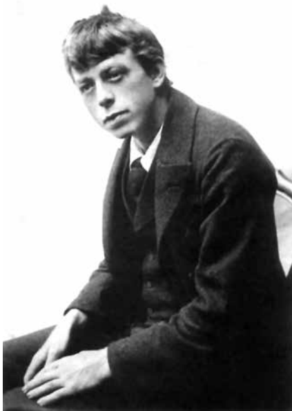
Una imatge juvenil de Robert Walser (1878-1956)

és una de les nostres tasques principals. Jo memoritzo amb molta facilitat, però a en Kraus li costa molt, i és per això que sempre estudia. Les dificultats que ha de superar són l'enigma del seu zel, i també en són la solució. Té una memòria lenta i, així, ho enregistra tot, encara que amb molt d'esforç. Allò que sap, li queda gravat al cap en metall, com si diguéssim, i no ho pot tornar a oblidar. Que alguna cosa se li pugui evaporar, ni parlar-ne. Allà on no s'ensenya gaire, en Kraus hi encaixa bé i, per tant, a l'Institut Benjamenta, hi encaixa estupendament. Una de les màximes de la nostra escola diu: