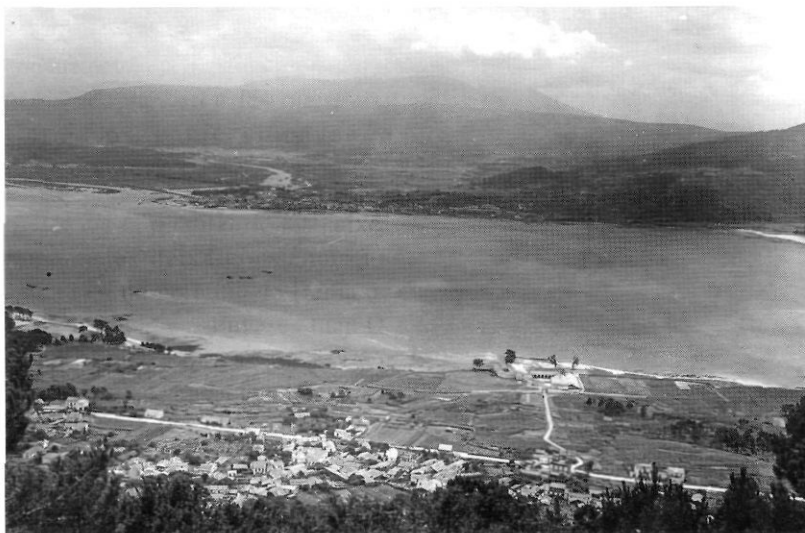
Camposancos i la factoria de La Armona a la vora del riu Miño, enfront de Portugal

La iniciativa tan audaç consistia a realitzar la producció integral dels envasos per a la pansa en la fàbrica esmentada per a, en acabant, transportar-los a Dénia en llistons apilats en la bodega dels vaixells que, en els viatges de tornada, disposaven de bastant espai.