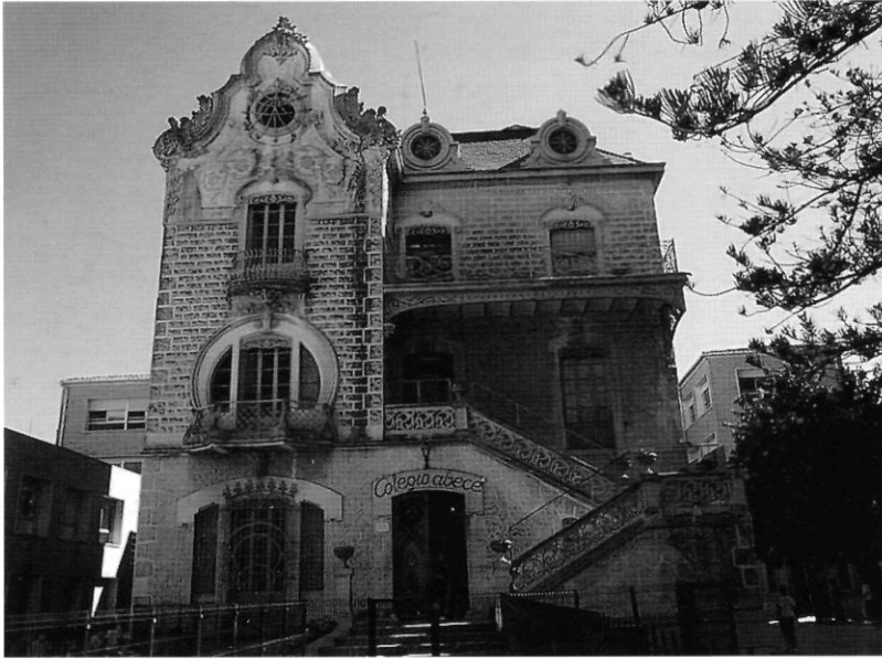
Residència de la família París a Gandia en 1908.

Va ser, sens dubte, aquest prestigi el que va convèncer aquestes famílies de deniers perquè s'embarcaren en semblant aventura perquè, encara que les condicions del trasllat van ser molt atractives, aquestes persones no tenien problemes d'ocupació en la Dénia d'aquella època.