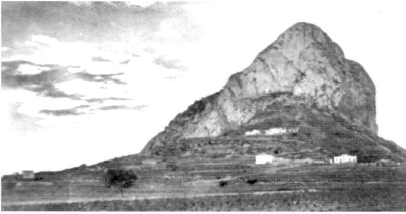
El penyal d'Ifac, amb la casa dels París en la part superior del vessant