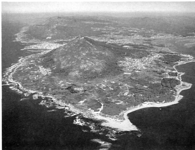
Panoràmica de Camposancos en la falda de la muntanya de Santa Tecla