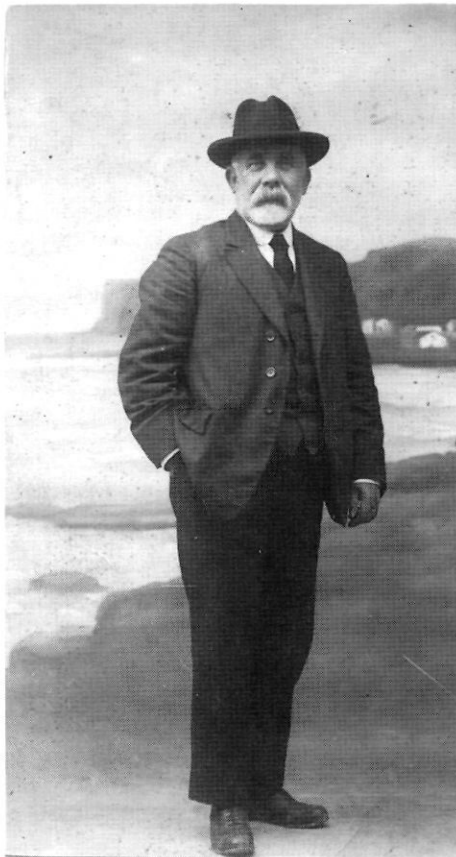
Evarist Llorens Ferrando (Dénia 1867-Camposancos 1928)