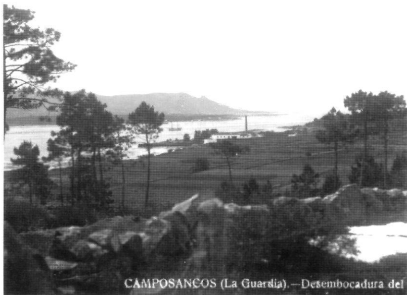
CAMPOSANCOS (La Guardia). — Desembocadura del

La Armona en l'estat original. La primera paret que s'observa constituïa el pavelló d'habitatges.