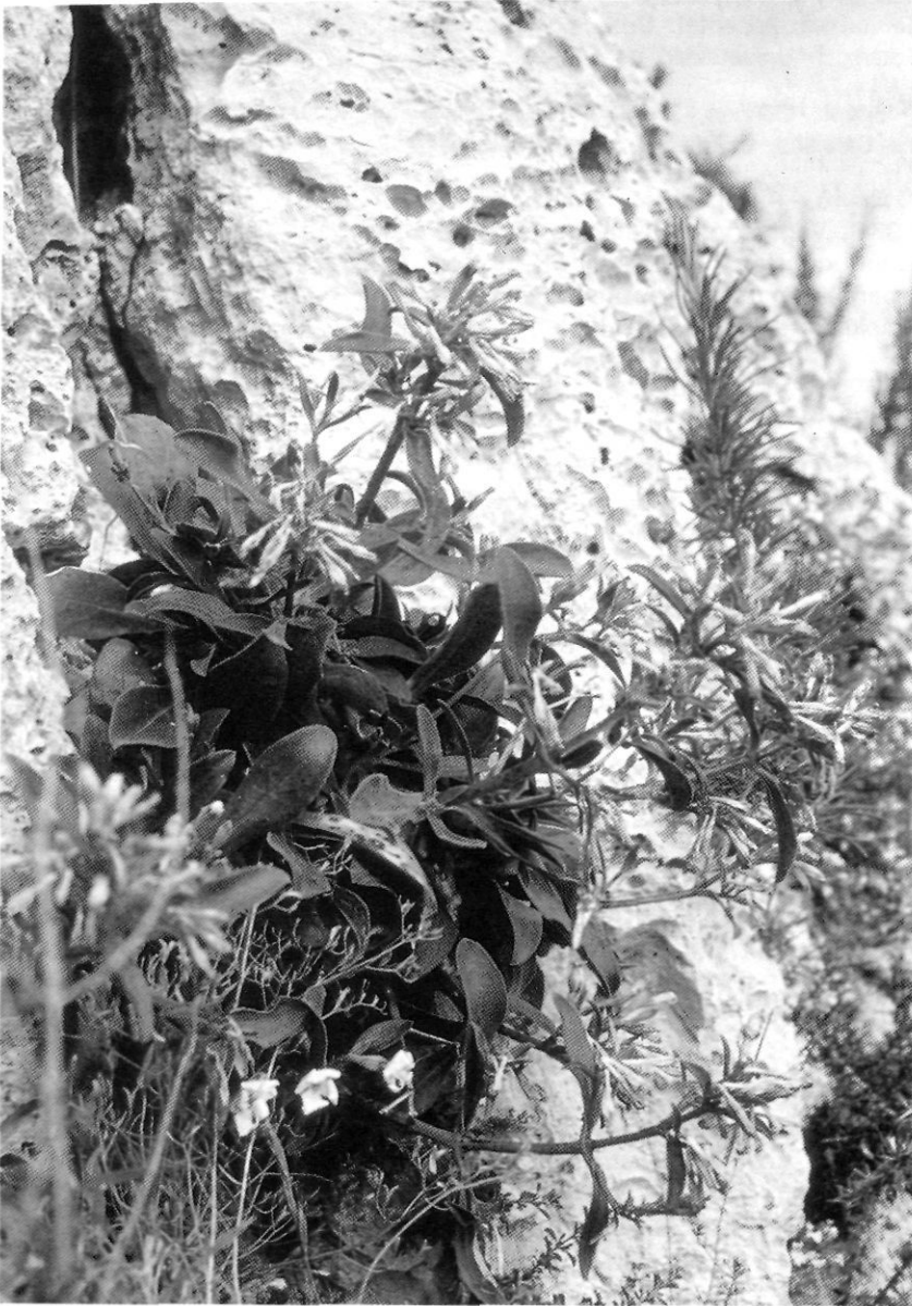
Exemplar del Cap de Sant Antoni

Inventari alçat a Sa Roca Esbarrada Costa Noroest d'Eivissa.