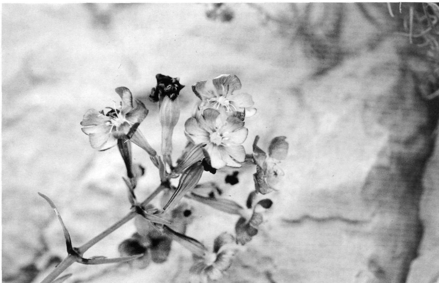
Exemplar de les costes de Benitatxell