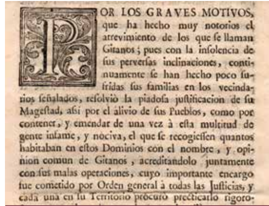
Ordre de presó del 28 de novembre de 1749.

La majoria dels alliberaments es van produir durant el mes següent a l'Ordre, i en la seua conformitat, el duc de Caylús va traslladar en 28 de novembre la resolució de restituir a les seues poblacions d'origen als que van ser alliberats. 18 A partir de llavors, el ritme d'excarceracions va disminuir, sent pràcticament nul al març de l'any següent.