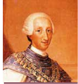
El rei Carles III

En termes similars va opinar l'abril següent el capità general de Catalunya, Marquès de la Mina, que també temia que una volta foren lliures, pogueren infectar " nuevamente el país con torpezas, robos y otros delitos ", per la qual cosa va proposar desterrar-los i embarcar-los amb els gitanos masculins amb destinació a Amèrica, o bé, traslladar-los a altres regions, especialment Andalusia. 43