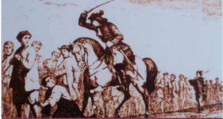
Gravat amb la fila dels capturats

s'establiren els magatzems provisionals -camps de concentració en termes moderns- en els quals s'havien de recloure tantes persones com fossen capturades, una vegada que havien estat separades per sexe i edat.