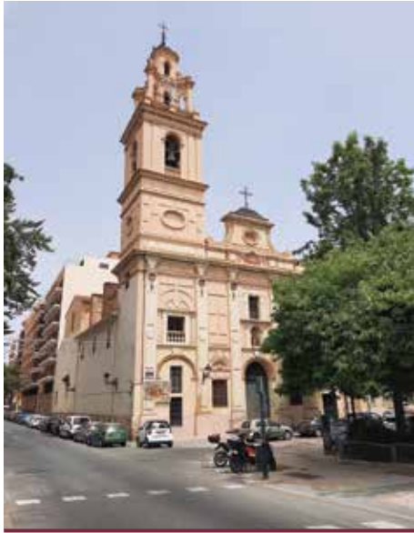
Església i convent de Santa Mònica i l'inici del carrer Sagunt (València)

En total, foren 120 dones les que es van recloure al palau de la Senyoria d'Oliva. La resta va passar el mes següent a una casa de la ciutat de València, situada a l'inici del raval del camí de Morvedre. 25