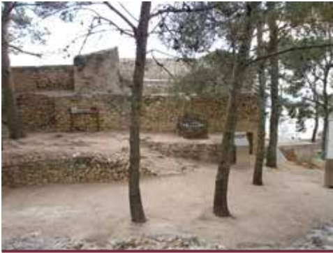
Interior del castell de Dénia

Les contínues afirmacions de Caylús finalment van prendre fruits el 20 de setembre de 1749, quan Ensenada el va informar de l'aprovació del rei " para desahogar la estrechez del depósito de gitanas de Denia ". Per a açò, es va acordar el trasllat a València capital, un total de dues-centes dones amb els seus fills xicotets, a més d'altres 47 persones de Ciudad Real 11 -entre elles, deu dones que tenien empresonats els seus marits a les mines d'Almadén. 12