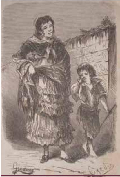
Gitana amb el seu fill

aconseguir que els intendants dels arsenals adreçaren primer el 16 de juny, després el 2 de setembre i, finalment, el 21 d'octubre de 1763, diversos oficis al Consejo de Castilla, requerint instruccions per enviar els gitanos a les seus respectius domicilis. El governador del Consejo, en resposta a la preocupació plantejada, va respondre el 24 d'octubre que estava preparat “ en avivar su pronto despacho ”, però que en aquell moment l'expedient estava a l'espera de les respostes dels fiscals del Consejo. 45