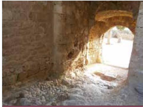
Porta d'accés interior del castell de Dénia

Aquest interès i preocupació pels gitanos no va ser compartit per altres autoritats valencianes, com l'intendent Malespina i l'arquebisbe de València, que van voler instrumentalitzar la ubicació del lloc del confinament de les dones a València per a aconseguir el seu propòsit de fer desaparèixer les comèdies de teatre de la ciutat, volent tancar les dones en el lloc que ocupava la Casa de les Comèdies, de manera que en cas d'aconseguir-ho " no dejar sitio, donde en tiempo alguno se puedan representar ". En el seu intent, va proposar a la Junta d'Administració de l'Hospital General, de la qual depenia la Casa, l'enderrocament de l'esmentada Casa de les Comèdies, per construir " en el terreno que ocupa, casas habitables ", la despesa de les quals fins i tot es va oferir a pagar. Un pla interessat que va ser rebutjat principalment pel fet que aquesta Casa de les Comèdies donava 3.000 pesos a l'any a l'Hospital General de València.