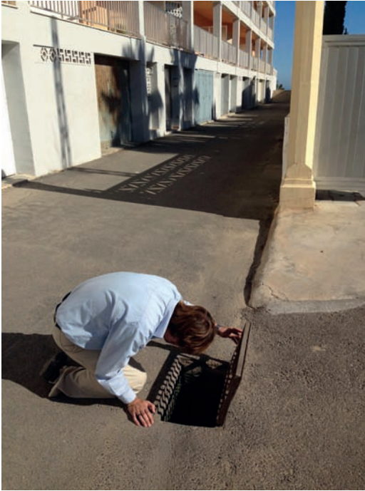
Figura 3. Procés d'inspecció als embornals on es varen detectar exemplars adults del mosquit tigre.

situació de repòs dins d'una línia d'embornals (Figura 3) a la zona de Les Marines (coordenades de la troballa: N 38° 52' 54.9'' / O 0° 01' 58.9''). La determinació taxonòmica del material entomològic capturat es va fer posteriorment en condicions de laboratori i seguint els criteris establerts per SCHAFFNER et al. (2001).