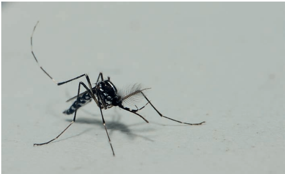
Figura 2. Detall d'un dels mascles del mosquit tigre capturats.

Després de la notificació de diverses queixes ciutadanes, canalitzades a través de l'Àrea de Medi ambient de l'Ajuntament de Dénia, relacionades amb picades per part de mosquits la descripció morfofocromàtica i etològica dels quals a priori podia ser coincident amb l'activitat del mosquit tigre, a l'octubre de 2014 es van realitzar una sèrie d'inspeccions entomològiques mitjançant el suport de safates recol·lectores d'aigua (denominades dippers) i aspiradors mecànics manuals que van permetre la captura d'un total de 4 mascles (Figura 2) i 2 femelles de Ae. albopictus . Tots els exemplars es trobaven en