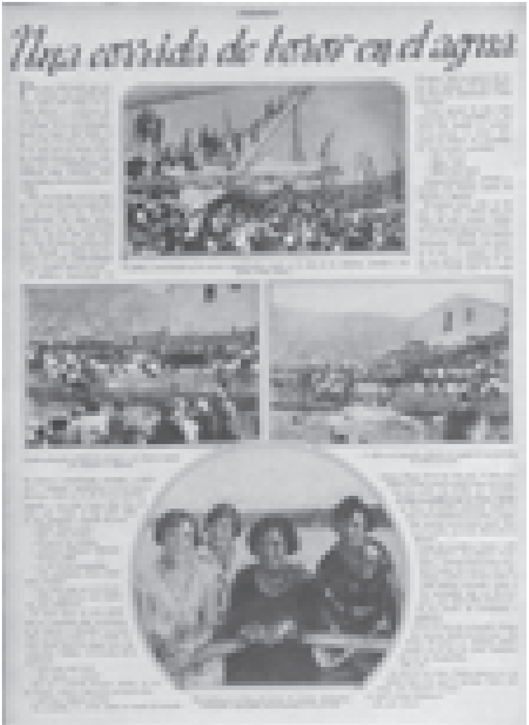
Revista Estampa, 26 de novembre de 1929. 2 a època, núm. 98 A.M.D. Fons Casimiro Sendra.