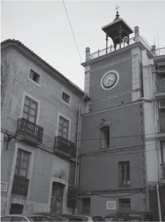
Torre de l'antic castell d'Ondara reconvertida en torre del rellotge.