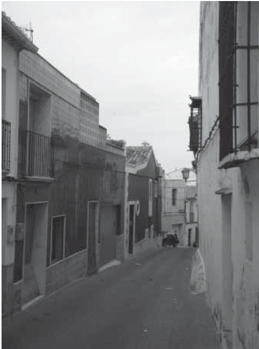
Carrer Sant Benet d'Ondara, pujada cap a la plaça on estava el castell dels Cardona.

moment en què s'escriu el document. L'escrivà que còpia els noms que van dient-li directament els veïns, tan cristians com musulmans, per la seua formació i experiència, coneix perfectament els cognoms cristians amb els quals no sol haver cap errada; no és aquest el cas en relació als cognoms i noms àrabs, menys coneguts. Així, quan l'escrivà recull els noms que li diuen en veu alta els musulmans escriu, amb la grafia que considera més adient i per tant susceptible de canvis, allò que està escoltant: noms i sobre tot cognoms que pot ser no ha sentit mai. El resultat doncs serà un tant divers i ens crearà dubtes a l'hora de buscar les similituds entre els cognoms amb la finalitat de determinar les diferents famílies. El tema es complica més quan comparem documents de diferents èpoques escrits per diferents escrivans, cadascun amb major o menor coneixement dels cognoms àrabs, les diferències entre les grafies poden ser fins i tot més acusades i la determinació de si és o no el mateix cognom resulta conflictiva o almenys discutible.