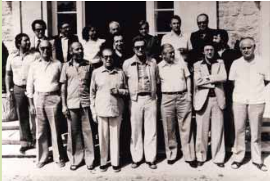
La Comissió dels Vint va acabar el projecte d'Estatut el 15 de setembre de 1978 al Parador de Turisme de Vic, prop del pantà de Sau