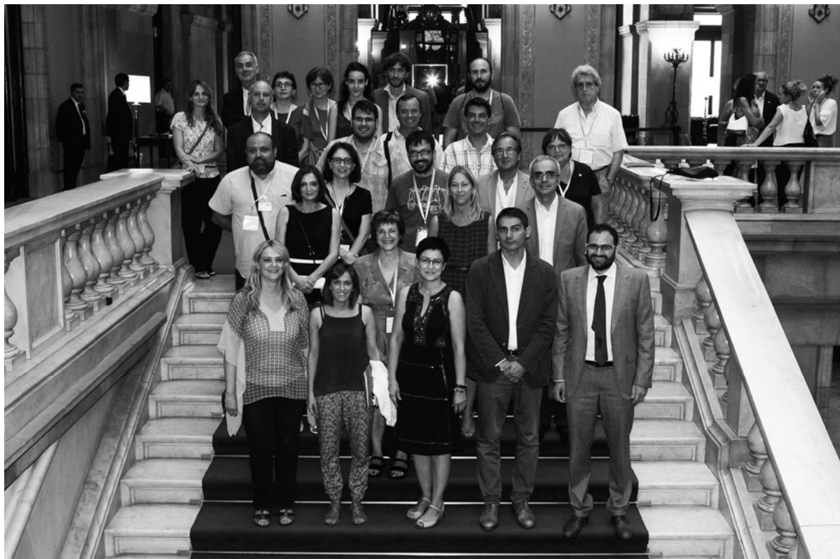
Membres de la ponència i de les associacions de voluntariat.

És, per tant, vital copsar la dicotomia entre el