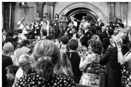
Aprovació de la Llei.

Un cop posades les bases relacionals, la Llei sí que entra a regular els instruments i les accions de les administracions per poder donar compliment a les finalitats de la Llei previstes en l'article 1r, i ho fa centrant-se de manera preponderant en les relacions del Govern de la Generalitat amb les entitats (art. 15 - 25), per més tard establir les actuacions que han d'implementar el conjunt de les administracions públiques catalanes (art. 26). El paper preminent que la Llei atorga al Govern de la Generalitat es fa encara més evident i explícit quan en l'apartat segon de l'article 26 li atorga el deure de vetllar pel compliment de les accions de foment de les administracions públiques, de manera coordinada i establint-ne els instruments i els recursos per fer-ho.