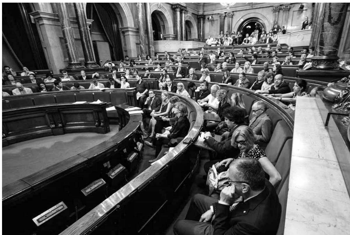
Moment de la votació.

Quins van ser els motius que van provocar aquesta regulació? És un fet demostrable que el Projecte de Llei, tal com va ser aprovat pel Govern, no satisfia tots els sectors de l'associacionisme del país, alguns dels quals no se sentien inclosos ni participants d'un text legal formulat i construït, segons algunes opinions,