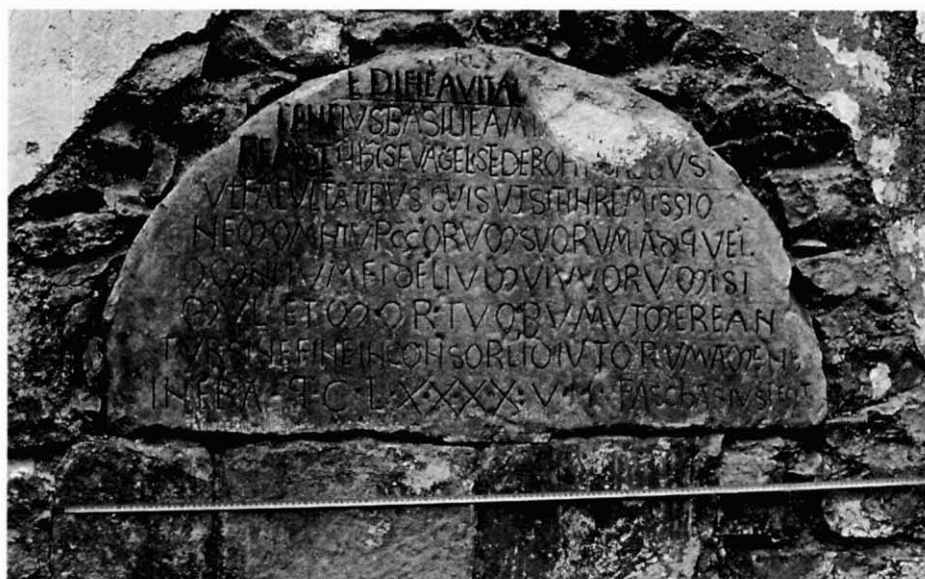
Fig. 2. El tímpano de Villavés (Burgos)