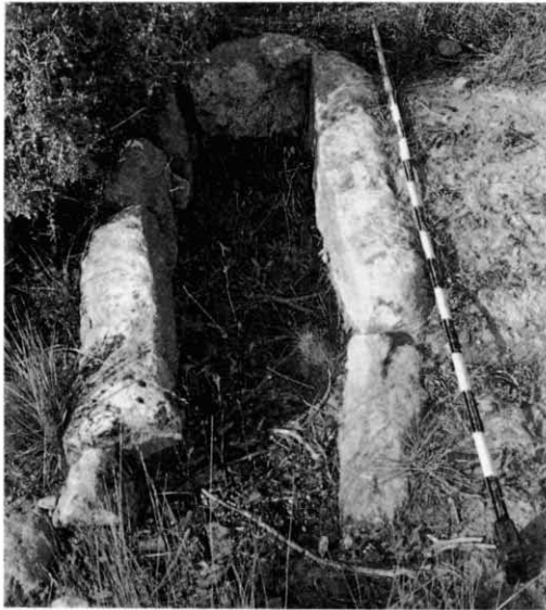
FOTO 2: Tomba n.º 1 de la necròpolis de Cal Pallerols (Sant Pere Desvim, Veciana)