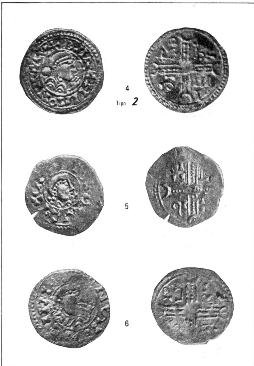
Lám. II. Moneda condal. Óbolos (1) de Berenguer Ramón II (1076-1096), desde 1082. El núm. 4 según la descripción del tipo 2, los restantes ejemplares variantes del citado tipo, no mencionadas en este estudio.