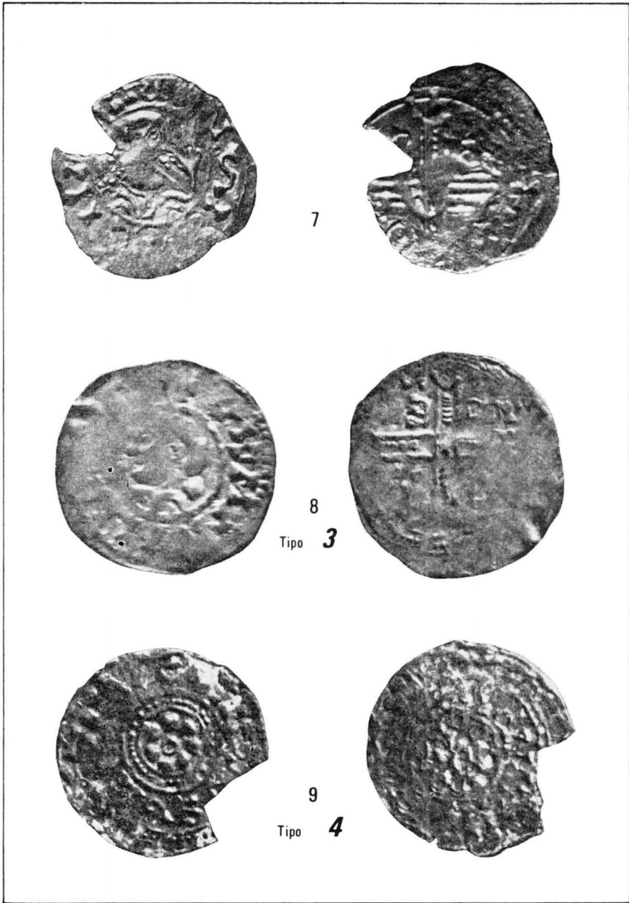
Lám. III. Moneda condal. Óbolos acuñados en Barcelona atribuibles a Berenguer Ramón II. El ejemplar núm. 7 es una variante del tipo 2, semejante al ejemplar anterior (lám. II, 6). El núm. 8 corresponde a la descripción del tipo 3 (óbolo 2 atribuible a Berenguer Ramón II, acuñado en Barcelona) y, por último, el ejemplar núm. 9 corresponde a la única pieza del tesoro perteneciente al tipo 4 (óbolo 3 de Berenguer Ramón II).