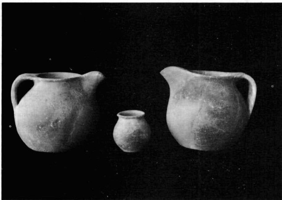
Fig. 9. Dos vasos del tipus 1A trobats a sota el Tinell, el de l'esquerra correspon a la fig. 3. Les dues peces són incompletes i foren «restaurades» fa anys; el vaset central no té res a veure amb el tema tractat aquí.

prop del mur que pel sud-oest tancava l'aula baptismal; tots ells eren oberts en els nivells d'enderroc i de sediments acumulats posteriorment a l'abandó del recinte, els quals en profunditat arribaven fins a trencar la conducció d'aigua que en aquest sentit arribava fins a la piscina. 11 El fet que es tracti d'una quinzena de fragments, dels que tres són peces gairebé senceres, sembla lligar amb un dipòsit de dintre un pou. 12 De moment no dispo de més detalls sobre la troballa, ni dels altres materials que hi podia haver juntament amb aquests.