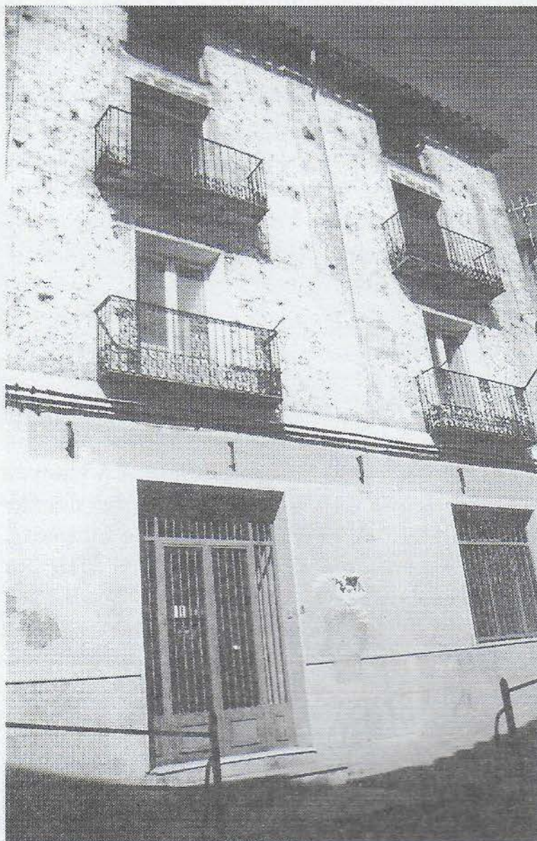
El segundo piso donde tenían el cuarto de estudio.