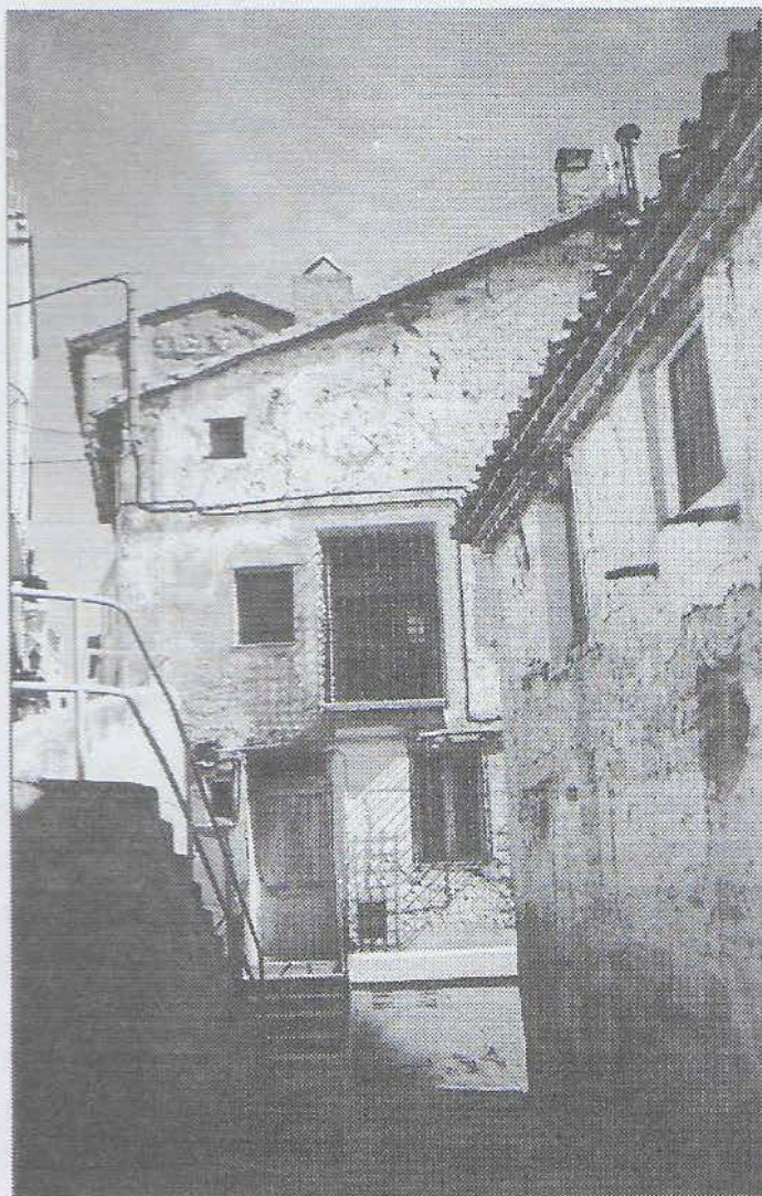
La casa de la que habla desde la calle Boticario.