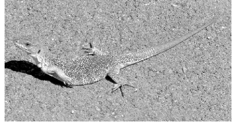
Lagarto ocelado.

mientos y práctica. La forma de las escamas de cabeza y dorso son necesarios para ello. En las dos primeras especies, del género Podarcis , todas las escamas del cuerpo son muy pequeñas; en las dos especies del género Psammodromus , las escamas del dorso son claramente más grandes y terminadas en punta.