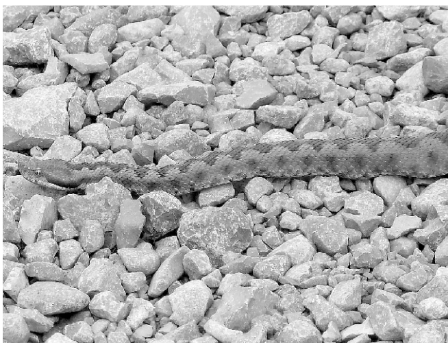
Víbora holicuda.

chada y casi triangular, el hocico levantado, la pupila del ojo vertical, la cola (parte del cuerpo desde el ano, más fino sin costillas) corta y el característico dibujo oscuro en zigzag del dorso sobre fondo de color gris a pardo-teja la diferencian de otras serpientes. Vive en zonas montañosas secas, pedregosas y rocosas con poca vegetación de la Península Ibérica y norte de África. Actualmente es muy escasa. En los montes del Rincón de Ademuz yo sólo he visto 3 durante los 23 años que trabajo como agente medioambiental.