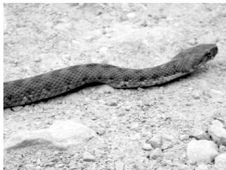
Culebra viperina.