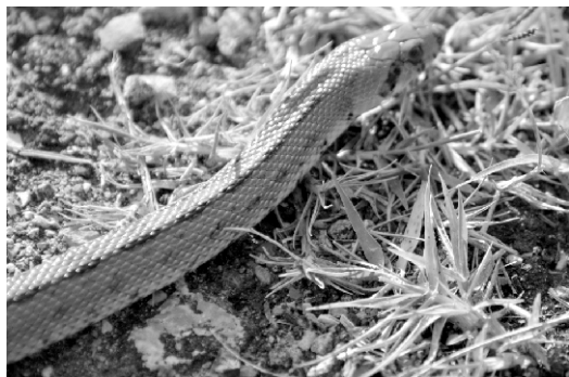
Culebra de escalera.