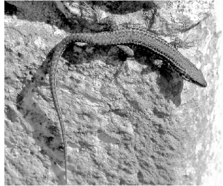
Lagartija ibérica.

OFIDIOS. Serpientes del grupo de las culebras y la víbora hocicuda.