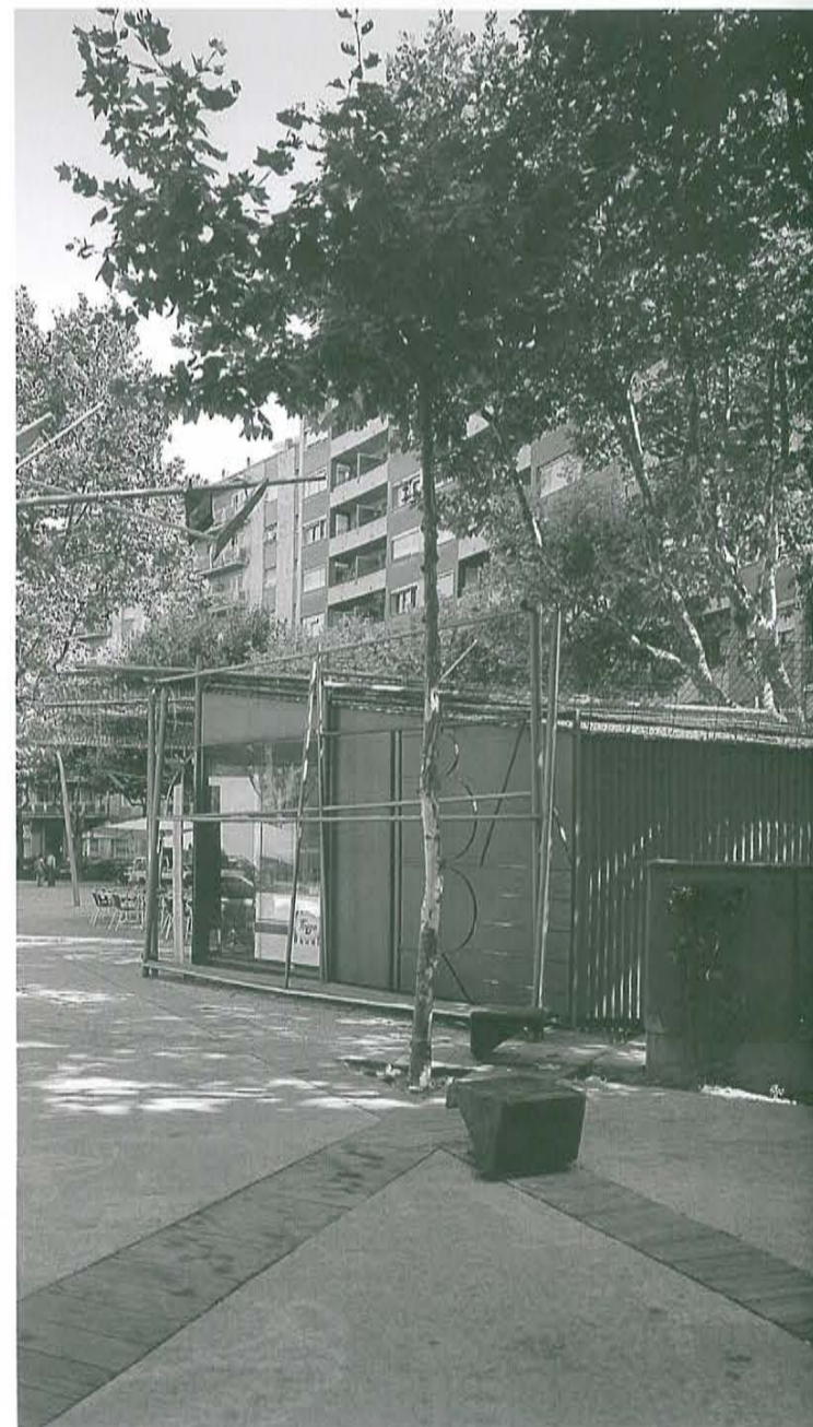
Passeig Prim