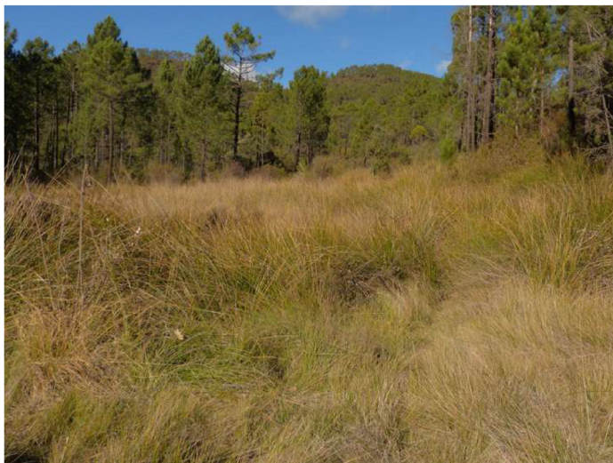
Fig. 2. Humedal donde habita Quickella arenaria en Villar del Humo (Cuenca, España).