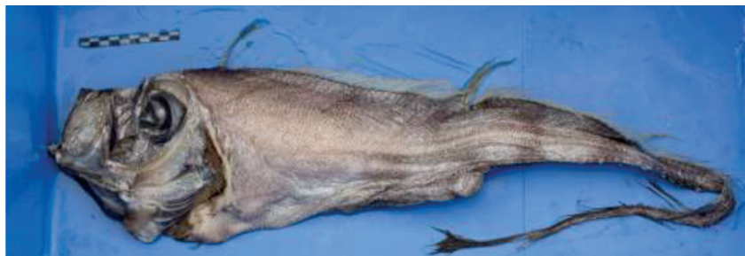
Fig. 3. Ejemplar 2 de 103 cm de longitud total, capturado el 16 de julio de 2014 a 35 millas al sur de la isla de Formentera (islas Baleares).

Fig. 3. Specimen 2 of 103 cm total length, captured on July 16, 2014 35 miles south of the island of Formentera (Balearic Islands).