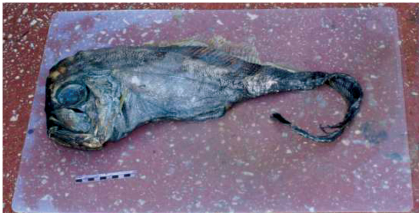
Fig. 2. Ejemplar 1 de 87,8 cm de longitud total, capturado el 30 de mayo del 2013 a 15 millas al sur de la isla de Cabrera (islas Baleares).

Fig. 2. Specimen 1 of 87.8 cm total length, captured on May 30, 2013 15 miles south of the island of Cabrera (Balearic Islands).