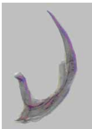
Fig. 2. Edeago de H. caraibus Sharp (100x).