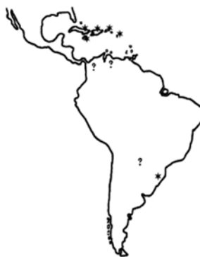
Fig. 4. Geographic distribution of H. caraibus Sharp: * Confirmed records; ? Not confirmed records.