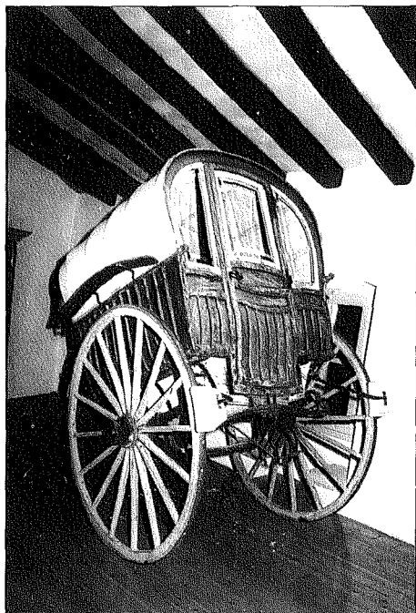
La Gabella, Museu Etnològic del Montseny. Arbúcies. Carreta.

en el fet d'anomenar encara avui dia, pel mot «taller» a les factories industrials de l'Ayats, En Beulas, En Queralt, En Noge... etc. El mot «taller» d'alguna manera ens transporta i ens evoca el passat artesà de l'ofici de carrosser i de les carrosseries. El «taller» aplegava a diferents oficis artesans (carreteres, fusters, basters, perolers, pintors... etc) que s'adaptaven a noves formes de treball. Així el carreter, el fuster, passen a ser carrossers, els basters són ara guarnicioners o tapissers, els ferrers canvien les ferradures per a especialitzar-se en altres tipus de tasques relatives a les carrosseries... etc.