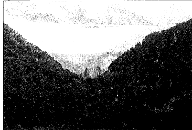
Presa de Susqueda.

Les característiques artesanals de l'ofici