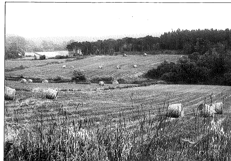
Camps de conreu de Maçanet de la Selva.

Al voltant d'aquesta activitat, la de la producció de dogues i rodells, s'assentà una de les activitats econòmiques més peculiars d'aquest país. Les grans pairalies de les Guílleries deuen en bona part el seu floriment a aquesta especialització econò-