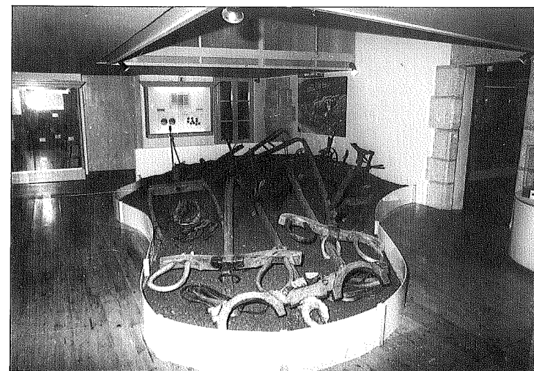
La Gabella, Museu Etnològic del Montseny. Roturació de terres.

Un altre aspecte que ens caldria analitzar