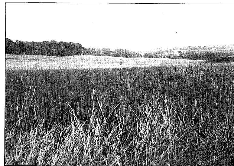
Camps de conreu de Maçanet de la Selva.

Per cloure aquesta exposició, i si hem de fer una valoració general de l'agricultura a la comarca de la Selva al llarg del segle XVIII, pensem que el balanç és positiu. El