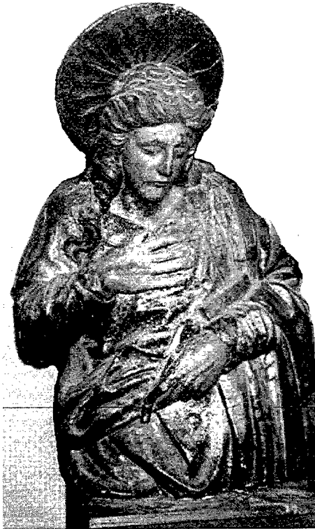
Figura 2. Talla anònima de sant Joan, procedent d'un sant enterrament de la primera meitat del segle XVI. Publicada a M. RUFÉ. Retaule de l'altar major, s. XVII. Rubí, 1992, p. 13.

comunitat de Sant Pere fos a la vegada l'encarregat de pintar un dels ornaments litúrgics podria resultar molt il·lustratiu de fins a quin punt l'art dins del temple quedava circumscrit a les habilitats disponibles entre la minsa població de la vila. El fet que no s'hagués cercat un pintor agremiat de Barcelona donaria mesura de la pobresa que aleshores es devia viure a l'església. Un inventari pres al principi de l'any 1509 enumera tots els objectes de valor, propietat de la parròquia, que es trobaven aleshores reclosos a l'interior de les capelles; els ornaments descrits bàsicament consistien en roba d'altar i en l'orfebreria litúrgica mínimament indispensable, oferint-nos la imatge d'un temple bastant despul·lat; els notaris en van tenir prou amb un foli per anotar-hi tots els béns. Tampoc el nombre d'altars no era elevat; el document únicament en dóna testimoni de quatre: l'altar major, el de sant Esteve, el dels sants Llop i Sebastià i el de santa Maria. En alguns d'aquests s'hi trobaven pal·lis de pinzell decorats