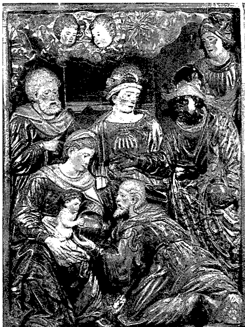
Figura 3. Francesc i Jaume Rubió, relleu de l'Epifania procedent del retaule de l'altar major de l'església de Sant Pere de Rubí (1607).

de la capella del Roser, impulsada per la confraria dedicada a una devoció que s'estenia amb força rapidesa per tot el Vallès i que es devia començar a edificar poc abans dels anys 1577 o 1578, dates en les quals estan documentades despeses i recaptos per aquest concepte. Cap al 1580 la capella ja devia estar a punt, ja que en aquest any l'obreria rebia diversos donatius per a la construcció del retaule. 12