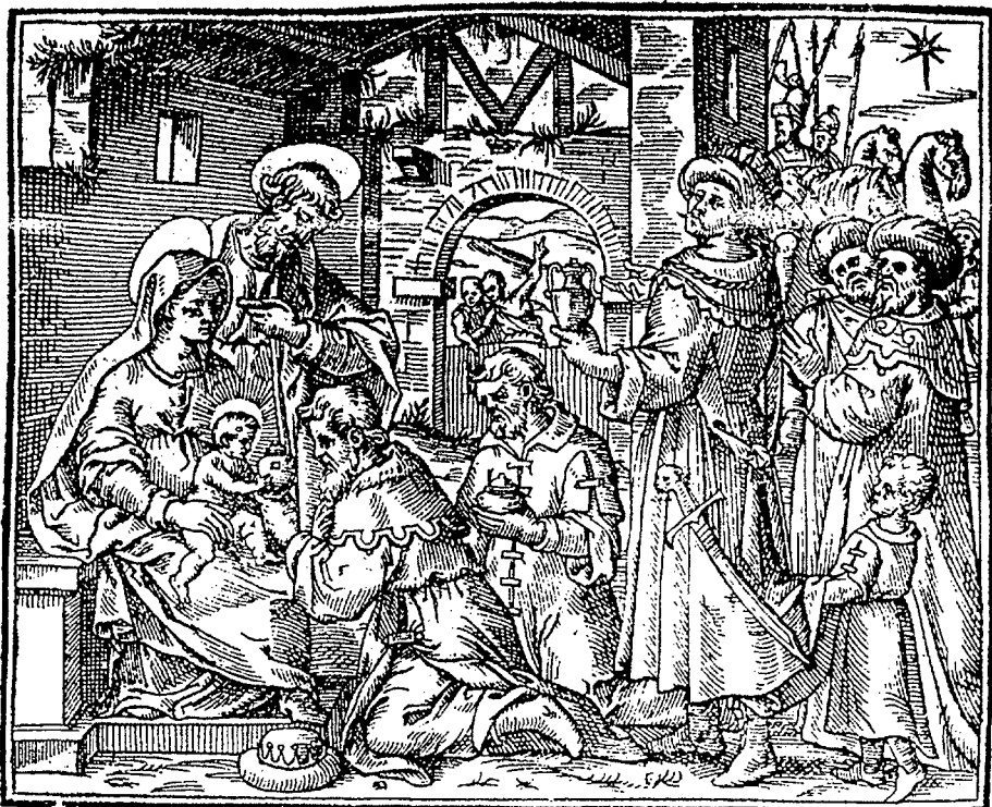
Figura 5. Antonio Tempesta, gravat de l'Epifania inclòs en una edició romana dels Evangelis apareguda l'any 1591 (publicat a In praesepeio, immagini della Natività nelle incisioni dei secoli XVI-XIX . Roma, 1987, p. 130).

La pintura mural al Renaixement català és una manifestació poc habitual i mal coneguda, tant pels pocs exemples arribats als nostres dies com pel caràcter epigonal que sembla haver pres davant de la pintura sobre taula o sobre llenç. No obstant això, s'intueix que es devia desenvolupar millor en l'àmbit de la residència privada que no pas a l'interior de les esglésies, on l'estructura del retaule va guanyar fermament la partida com a ornament preferent. És encara un interrogant per què la pintura al fresc, que de manera tan abundosa, qualitativament i quantitativa, es va prodigar al Renaixement italià, no va tenir un ressò o un paral·lelisme mínim als edificis públics dels regnes del llevant peninsular, tan receptius a d'altres formes i novetats vingudes d'Itàlia. El desconeixement dels acurats requeriments tècnics demanats per aquesta modalitat, unida a la forta tradició de pintura moble mantinguda als tallers catalans, segurament explicarien en bona part el barrament experimentat en les empreses de caràcter religiós. Tot i així, és difícil de creure que l'edifici civil