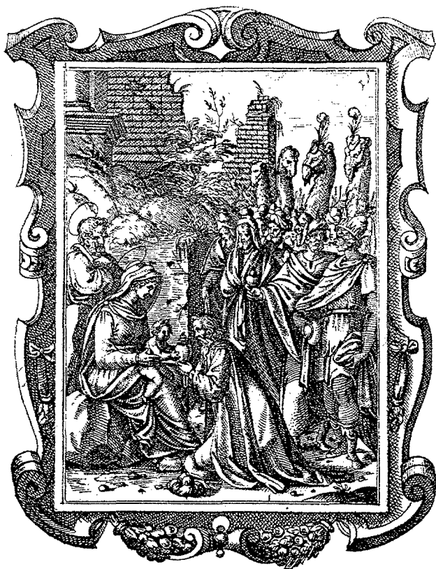
Figura 4. Bernardino Passari, gravat de l'Epifania inclòs al Rerum Sacrarum liber , de Lorenzo Gambara, obra editada a Anvers l'any 1577 ( The Illustrated Bartsch , Nova York, 1982).

l'interior del temple pintant «les claus y evangelistas de pedra y las parets de la capella del Roser, dins dit temps, ab alguns personatges o ystòries y altres pintures que convindrà, tot al temple, bé y decentment, ab ses colós bones y vertaders, y ab tota perfectió». 13 Els evangelistes esmentats feien referència a les escultures dels capitells medievals, al seu emplaçament original o potser reaprofitats durant les obres de construcció de la capella. Més significatiu és el fet d'haver estat projectat un cicle de pintura mural al tremp, del qual avui dia no en tenim constància física; 14 és possible postular que els murals mai no s'haguessin realitzat, ja que, dos anys després de signat el contracte, els jurats de Rubí Pere Canals i Jaume Serra van anar personalment a Barcelona, a casa del pintor, per lliurar de pròpia mà els diners que el municipi quedava a deure pel retaule, i en l'acte de pagament, que va significar la cancel·lació de la concòrdia del 1585, no es féu cap referència a aquesta empresa. 15