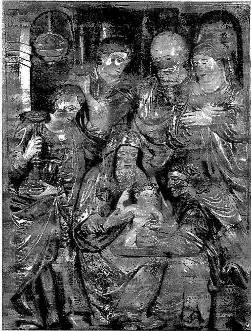
Figura 6. Francesc i Jaume Rubió, relleu de la Circumcisió procedent del retaule de l'altar major de l'església de Sant Pere de Rubí (1607).

Tret de la capella del Roser, i fins on ens ha estat possible saber, no sembla que el segle XVI rubinenc hagi deixat cap més evidència artística ressenyable,