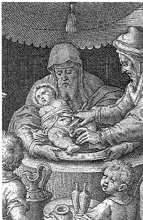
Figura 8. Detall de la figura 7.

Crist. D'altra banda, J. Comellas Rosiñol també apuntava la possibilitat d'identificar l'escultura com un sant Joan, un personatge que apareix invariablement en aquest tipus de grups, per bé que sant Joan se'l solia representar sovint abraçant una Mare de Déu desconsolada; la ploma que sembla tenir a la mà podria corroborar aquesta proposta, tot i que el llibre que l'acompanya és també un atribut que en ocasions apareix en mans dels personatges femenins dels sants sepulcres, com és el cas de l'esmentat de Liatzasolo a Terrassa, a tall d'al·lusió als llibres d'oracions de difunts.