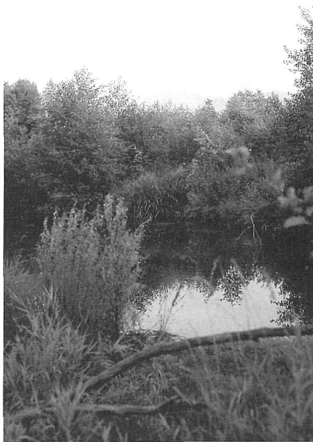
Un dels últims ambients humits de la comarca.

Un altre aspecte relacionat amb l'activitat turística és el projecte de possible ampliació o bé remodelació de l'actual aeròdrom, sobre el qual s'ha de pronunciar el Consell Comarcal. Una eventual ampliació i adequació per a rebre vols comercials suposaria, d'una banda, greus perjudicis pel poble de Sanavastre, situat al entorn de l'aeròdrom i, d'altra banda, la desaparició de diverses hectàrees de conreus i vegetació de secà per donar cabuda a l'ampliació de la pista. A part del valor agrícola de la zona per a conreus cerealistes, cal destacar que hom hi pot trobar encara els escassos exemplars de torlit ( Burhinus oediconemus ) i arpella pàl·lida ( Circus cyaneus ). Evidentment, seria desitjable que l'actuació sobre l'aeròdrom es limités a una simple millora de les instal·lacions que fes rendible l'actual ús esportiu que se'n fa.