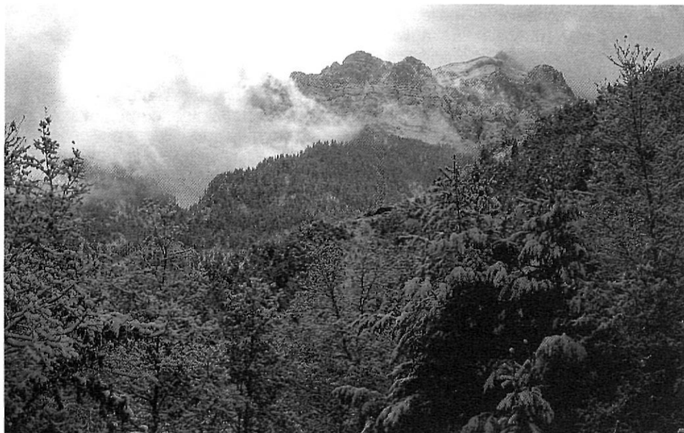
Magnífic aspecte d'un bosc subalpi a la serra del Cadí.

La planificació de l'activitat turística dins el Parc es basa en dos punts: la creació de la infraestructura necessària