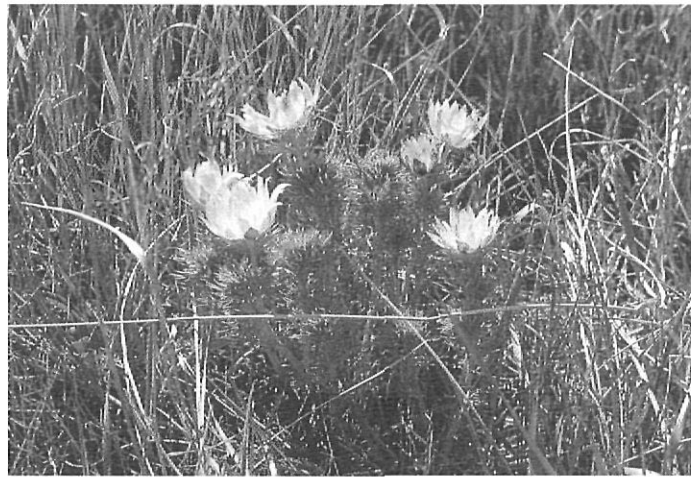
Adonis vernalis , ranunculàcia latesarmàtica de floració primerenca als tossals de la plana cerdana, on existeix l'única població de Catalunya i una de les poques de la Península.

Els factors fins ara descrits fan que siguin els prats subalpins i l'estatge alpí els únics ambients que conservin llurs característiques naturals. Aquests prats i la part alta dels boscos formen part de la Reserva Nacional de Caça de la Cerdanya-Alt Urgell, la qual s'estén cap a ponent dins els límits d'aquesta última comarca. L'isard —l'espècie més carac-