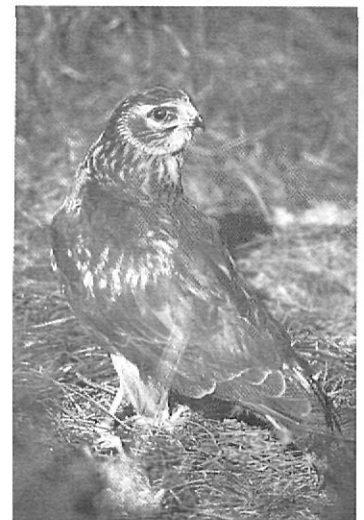
L'arpella pàl·lida ( Circus cyaneus ) disposa actualment de molt poques localitats de cria al nostre país, una d'elles a la Cerdanya.

A la solana, però, existeixen pistes d'esquí nòrdic: les de Lles i les d'Aràns. A més, l'Ajuntament de Guils pre-