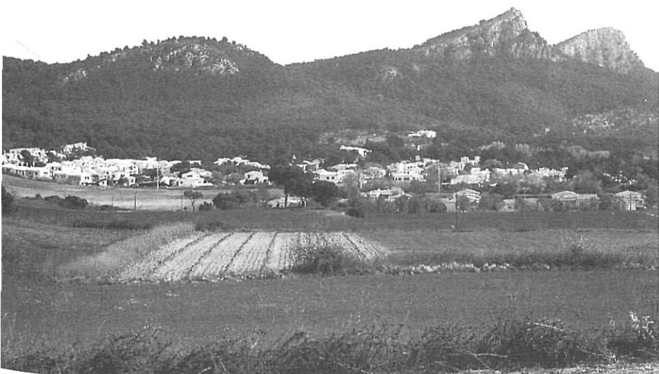
L'Escala i l'Estartit han deixat créixer massa les seves urbanitzacions a la zona del Montgrí.