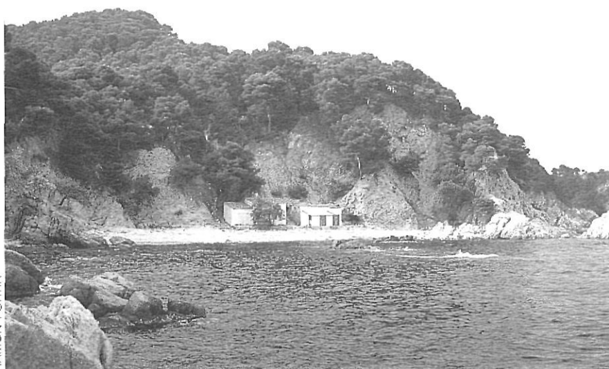
La cala del Crit, al municipi de Mont-ras, ha patit diversos intents d'urbanització en aquests darrers anys.

La bellesa encara de molts paratges de la Costa Brava del Baix Empordà, demana una ràpida i efectiva intervenció de l'Administració per tal d'evitar-ne el seu accelerat procés de destrucció.