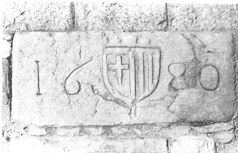
Labra heráldico. — Cronológica. — Pilar de la Torre de defensa.

Dos elementos componen, pues, estas referencias en piedra: uno de carácter heráldico, bien definido, y otro cronológico, algo desconcertante. ¿Cuál es su verdadera significación en el lugar que ocupan? En cuanto a lo primero, el escudo corresponde indiscutiblemente al de la universidad o municipio bisuldunense de la épo-