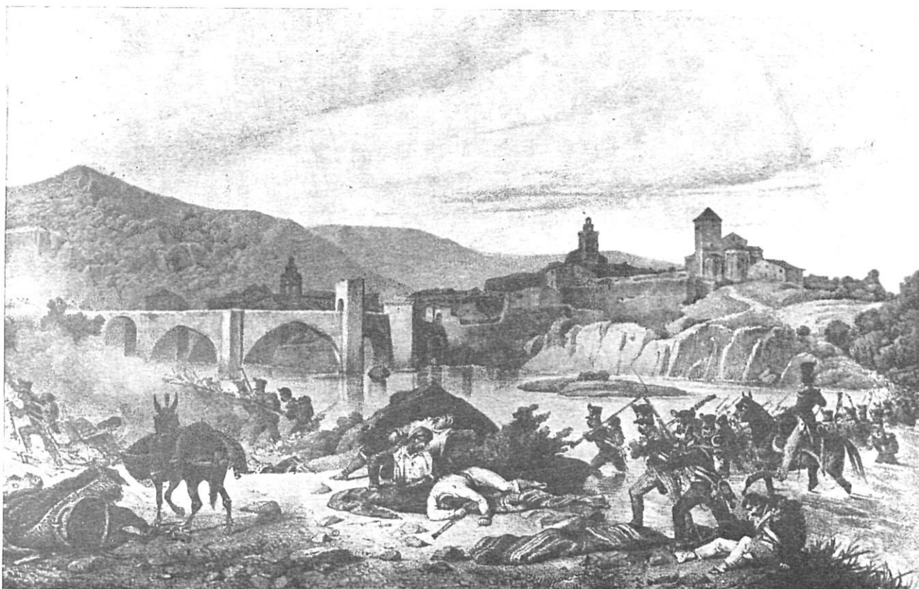
Grabado de J. Ch. Langlois — Guerra de la Independencia

copia algo metamorfoseada debida a mano ajena? Sea lo que fuere, no podemos considerar la acuarela más que como simple variante del grabado.