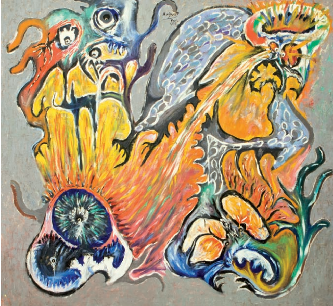
>> Ballet de la vida i la mort 2, 1948. Oli / tela. . 200 x 200 cm.