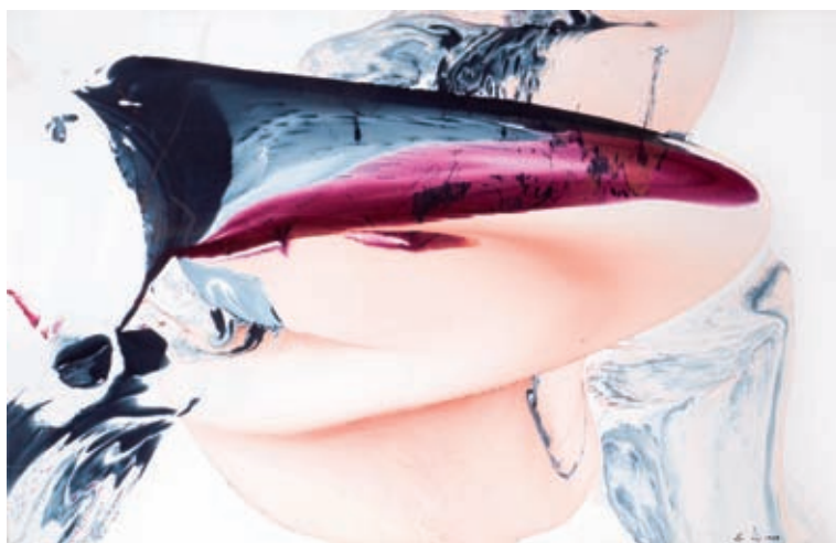
>> Salomé, 1988. Oli / tela. 115 x 180 cm.