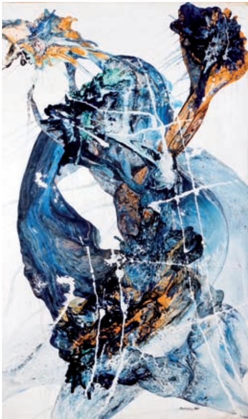
>> Silvà, 1961. Oli / tela. 195 x 114 cm.