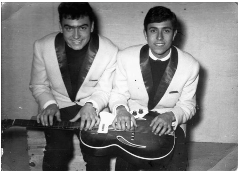
Dúo Blue Joans.