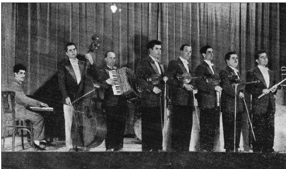
Conjunt de corda.

dels Jueus, hi nasqué el 5 de maig de 1884 l'eclesiàstic, literat i pensador Carles Cardó Sanjuan. Com passa el temps! Em vaig adonar que el rellotge no s'atura i la memòria em retrocedí un grapat d'anys enrere.