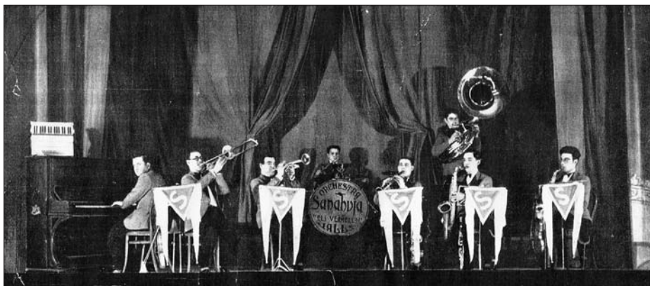
Orchestra-Jazz Sanahuja Els Vermells de Valls.