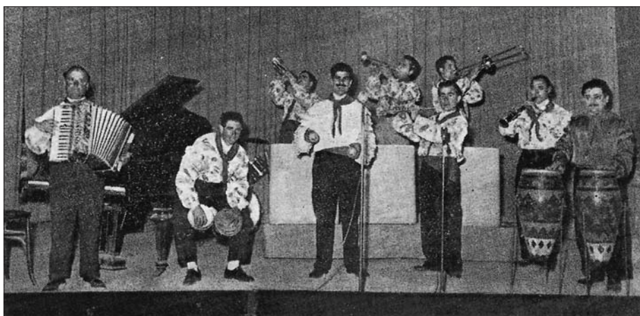
Conjunt típic cubà.

Segur que m'he deixat de testimoniar altres músics i agrupacions musicals que van existir a Valls en aquelles dècades del segle passat que he recordat; la meua intenció no era fer-ne un repàs fil per randa, sinó anotar el que m'ha donat de si la memòria i les fotografies i documents que tinc. Prego perdó a tots els que, involuntàriament, he deixat al tinter.