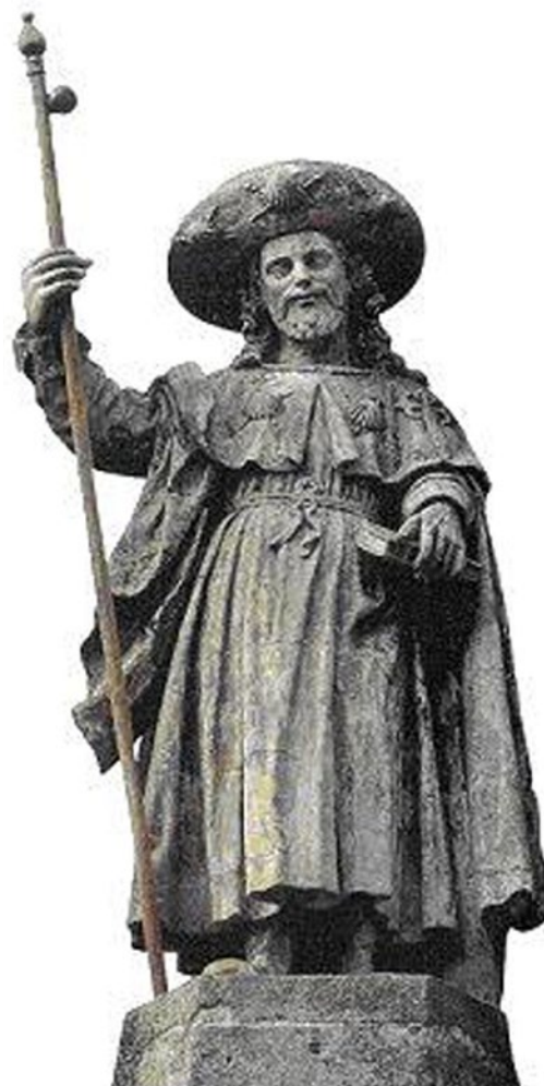
Imagen: escultura barroca de Santiago Apóstol, con el hábito característico del peregrino. http://parroquiasanjuanlaspalmas.blogspot.com/

El significado genérico, de todos estos nombres que pertenecen a diferentes variantes dialectales del euskera, es el de "piedras de Santiago"