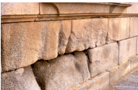
Fig. 8. Acanaladuras y pátina en granitos del Palacio de Ríofrío (Segovia).

La presencia de eflorescencias salinas y costras de sulfatación son depósitos cristalinos de sales que se generan en la superficie de la piedra. Las eflorescencias son películas delgadas de aspecto polvoriento y poco compacto. Cuando los depósi-