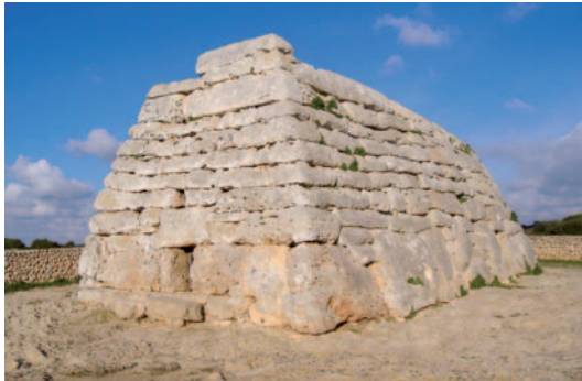
Fig. 1. Naveta des Tudons en Menorca.

Neolítico se construyeron las primeras estructuras en piedra, de carácter funerario, entre las que destacan las tumbas megalíticas de Newgrange, en Irlanda, con una antigüedad de 3200 a.C. o el Gran Menhir partido, en Francia, con una datación de 4500 a.C. Los dólmenes y menhires son construcciones muy abundantes en los países europeos, en España se resaltan los localizados en Antequera (Málaga) como son el Dolmen de Viera (4500 a.C.), El Megan (2500-2000 a.C.) y el Dolmen de El Romeral (1800 a.C.), pertenecientes estos últimos al Calcolítico. Otras construcciones de estas épocas son el yacimiento de Los Millares en Santa Fé de Mondújar (Almería) (2400 - 2000 a.C.) (Lucas, 1991). También se pueden citar como arquitectura prehistórica los tayalots, taulas y navetas de las Islas Baleares con dataciones de 850 a.C. (Fig. 1).