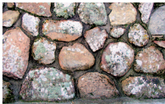
Fig. 3. Muro de mampostería de granito con colonización de líquenes.

– En función de su tamaño y dimensiones, los bloques obtenidos de la piedra de construcción se pueden denominar: sillares, sillarejos, mampuestos, losas, adoquines, etc. Los sillares son grandes bloques de piedra perfectamente labrados que adoptan forma de un paralelepípedo rectangular. El sillarejo es de peor labra y ajuste, con bloques más pequeños; sillar pequeño, labrado toscamente, de peor ajuste con las otras piezas y que no atraviesa todo el grosor del muro. Los mampuestos son piedras de pequeñas dimensiones, de forma más o menos irregular y nada o apenas desbastadas, que pueden ser fácilmente manejadas por un solo hombre; su peso y volumen coinciden con el peso y volumen de los sillarejos (Fig. 3).