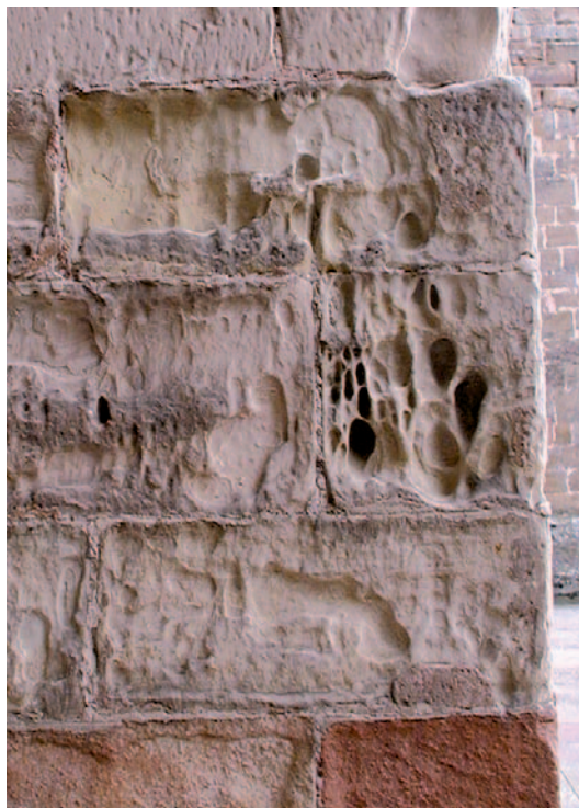
Fig. 12. Alveolización y arenización en sillares de la Catedral de Sigüenza (Guadalajara).

Rupturas. Esta patología implica la rotura de la piedra. Algunas roturas están relacionadas con las