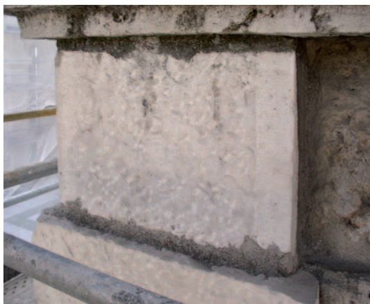
Fig. 4. Sillar de caliza con acabado de abujardado y apiconado.

Flameado. Consiste en aplicar altas temperaturas a la superficie de la piedra (2500 °C) que generan una fusión de la superficie de los minerales lo que hace que sea un acabado muy resistente a los agentes de deterioro. Suelen dar una superficie con cierto relieve, rugosa, algo craterizada y vítreo