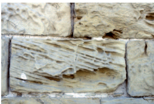
Fig. 11. Estrías en sillares de caliza en Tortosa (Tarragona).

Si la morfología de la pérdida de material es no lineal, se forman los picados, que son pequeñas