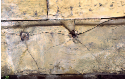
Fig. 13. Fisuras por incompatibilidad de materiales en sillar de San Sebastian (Bilbao).

características propias de la piedra como es la pizarrosidad, las diaclasas, la esquistosidad, los estilolitos, las vénulas, etc. Pueden diferenciarse varios tipos de rupturas según afecten a la estructura propia de la roca. Las rupturas paralelas a la superficie del sillar o pieza de labra, se denominan desplazado, descamación, etc.; si se disponen sin orientación definida, o perpendiculares a la superficie de la piedra, se denominan fracturas. El origen de estas rupturas es variado pero siempre implica unos esfuerzos mecánicos que pueden ser generados por: la carga diferencial, acciones de cristalización de sales, heladicidad, actividad biológica, hinchamiento de arcillas, oxidación de elementos metálicos, etc. (Fig. 13).