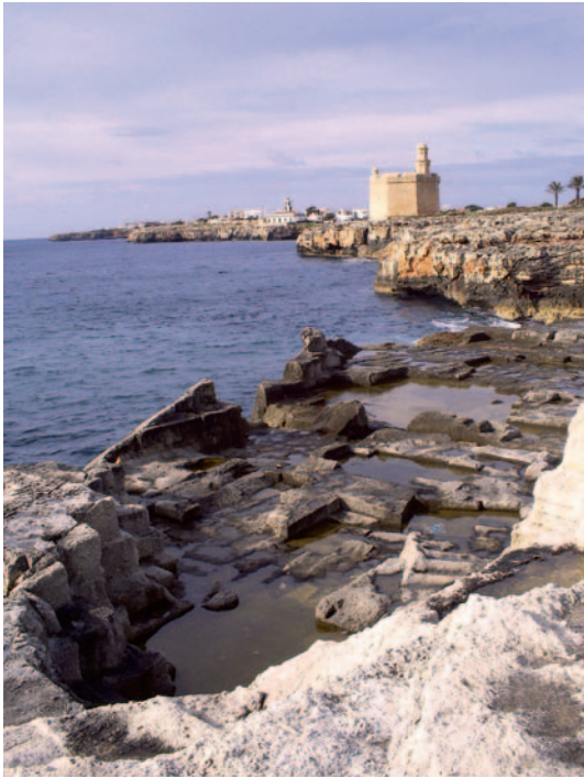
Fig. 5. Cantera de piedra Marés en Ciutadella (Menorca).