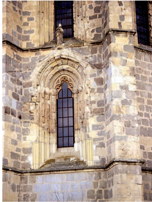
Fig. 6. Sillares de caliza y granitos en Santa María de Nieva (Segovia).

destacar numerosas piedras tradicionales de construcción como son: Piedra de Boñar (León), Hontoria (Burgos), Campaspero (Valladolid), Calatorao (Zaragoza), etc.