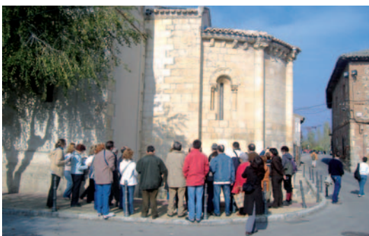
Fig. 2. Ruta Geomonumental en el patrimonio arquitectónico de Talamanca de Jarama, Madrid.

La piedra de construcción utilizada en el patrimonio es un buen recurso didáctico ya que a través de ella se pueden conocer los materiales geológicos existentes en una región (Pérez-Monserrat et al , 2008). Igualmente, en la piedra utilizada en los monumentos y en los edificios de las ciudades se pueden apreciar muchos fenómenos de alteración que se generan por la acción del medio ambiente urbano en que se encuentra. Estos procesos, en muchos casos, tienen su similitud con los procesos de deterioro en medios naturales. Por este motivo, ya en la década de los años ochenta se promovieron en el ámbito internacional y nacional lo que se denominan los itinerarios geológicos urbanos con fines educativos y de divulgación científica, una muy buena herramienta para la enseñanza de la geología