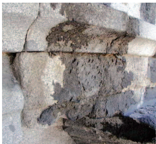
Fig. 10. Costra negra en granito del Palacio Real de Madrid.

Los procesos de disolución de materiales y su posterior precipitación dan lugar a las denominadas concreciones cuando la precipitación de las nuevas fases minerales se depositan en la superficie de la piedra; se denominan costras blancas cuando son concreciones de carbonatos o de sales de tonos blanquecinos procedentes de la disolución de la propia piedra caliza o los morteros de juntas. A veces pueden generar estalagmitas o estalagmitas. Si, por el contrario, estas fases minerales penetran en el interior de la piedra generan un proceso de consolidación de la piedra y darían lugar a lo que se denomina incrus-