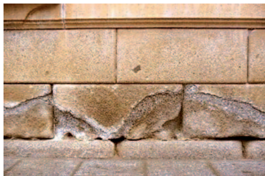
Fig. 9. Desplacado y subeflorescencias en sillares de granito.

tos de sales se localizan en el interior de la piedra, y no en su superficie, se denominan subeflorescencias (Fig. 9). Las costras tienen un grosor mayor, están ligeramente endurecidas y constituidas por sales y/o partículas (silicatos, carbonatos, metales, etc.) de procedencia diversa, como es la contaminación atmosférica que suele generar las denominadas costras negras. Estas costras negras se generan principalmente en materiales calcáreos, aunque también son frecuentes en edificios de granito debido a la disolución de los morteros de cal de la juntas de los sillares o de los minerales cálcicos (plagioclasas) (Fig. 10).