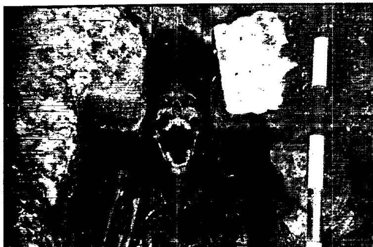
Detall tomba 3