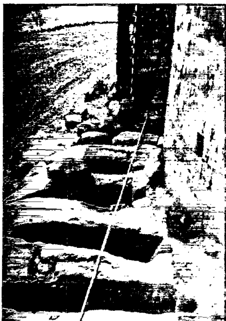
Monestir de Sta. Maria de Lluçà, vista exterior de l'absis un cop excavat, març 1982.