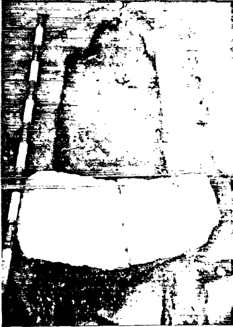
Tomba 5, abans d'excavar