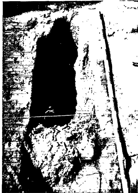
Tomba 5, un cop excavada. Es veuen els ossos acumulats a la part central.