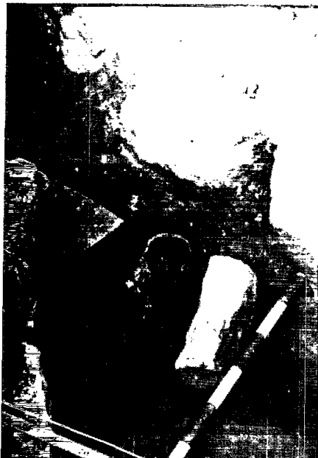
Detall tomba 1, amb la canalització que l'atravessa, març 1982.