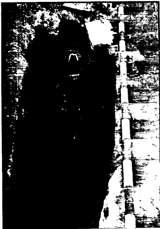
Tomba 3, amb l'esquelet «in situ»