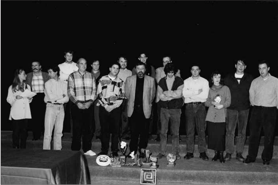
Participants i membres del jurat després del lliurament de premis a l'escenari del Teatre Atlàntida (1994).

Piscine par pecheurs , d'Albert Altés, va guanyar el premi «Mr. Belvedere».