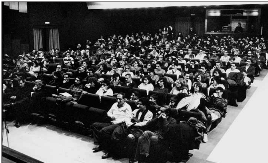
La «platea de Groucho's» del Teatre Atlàntida (1992).