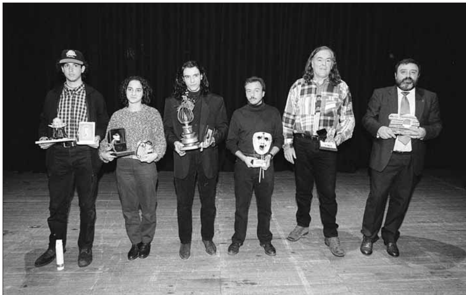
Els guanyadors dels premis del desè certamen que no varen quedar deserts (1996).

fàcil i assequible tasques i funcions cares i complexes per als formats analògics de vídeo i pràcticament impossibles per als formats cinematogràfics no professionals. Tot plegat féu que, en comptes de produir-se el llanguiment progressiu del concurs, un escenari ja previst pels organitzadors, allò que s'esdevingués fos un esfondrament sobtat. La desmoralització va ser total i anunciava el col·lapse definitiu que es va produir l'any següent i que féu que la desena fos l'última edició del certamen en el seu format original.