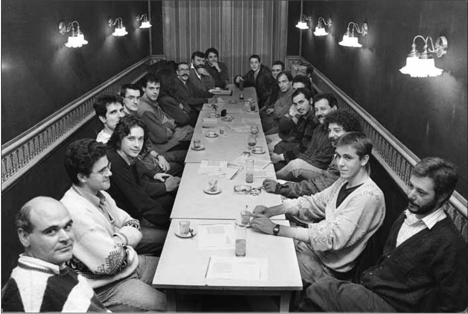
El col·lectiu Ull Cluc en una reunió preparatòria del cinquè concurs al Casino de Vic (1991).