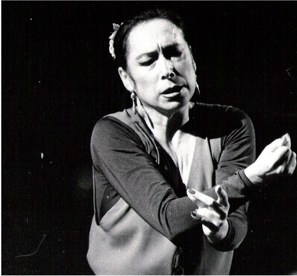
■ Cristina Hoyos.