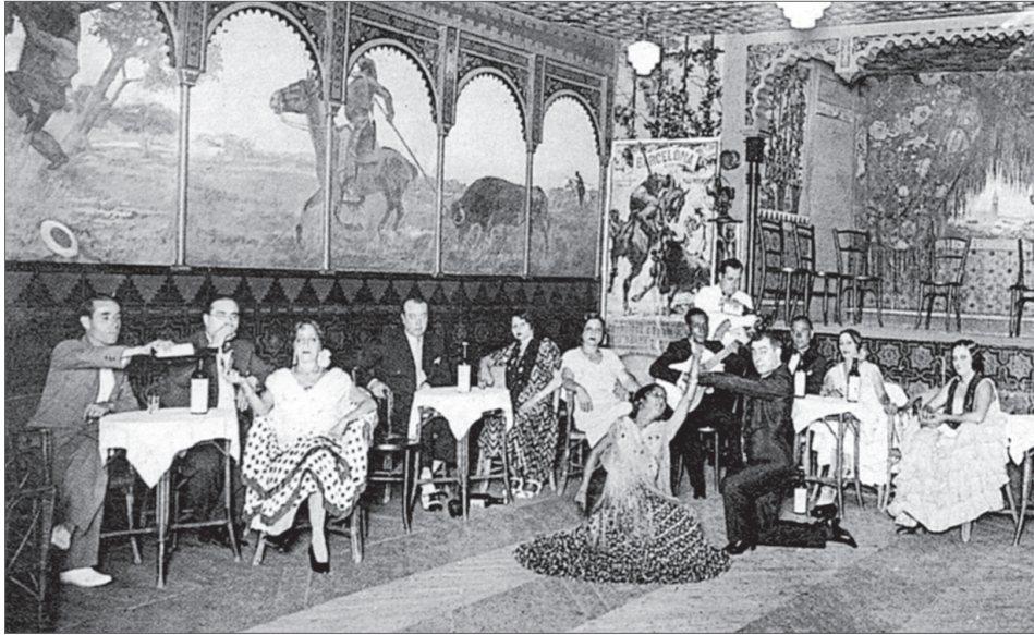
■ El salón Villa Rosa, antes conocido con Casa Macià, a principios de siglo.

sición de estilos amenizara el espectáculo. De cualquier modo, el estilo bolero cae en desuso a finales de siglo.