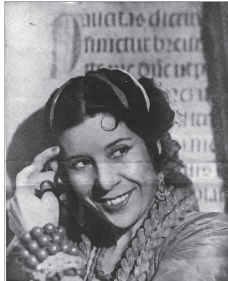
ENCARNACION LOPEZ ARGENTINITA CREADORA DEL BALLET ESPAÑOL

Diferente es lo que pasa con la música, que aún en tiempos de crisis discográfica y existiendo también intrusismos en ese terreno, vende más que la más pequeña de las artes. Pero sí que ha surgido una joven generación catalana de músicos flamencos que tienen el consentimiento y una aceptación identificativa con Catalunya, con respecto al baile, y aunque no lleguen a tener la fama de los bailarines mediáticos están presentes en programaciones importantes nacionales e internacionales, en eventos significativos, comparten su arte con otras disciplinas, etc. Todos ellos están aportando interesantes trabajos para el enriquecimiento artístico en una calidad superior, llegando a ser representantes indispensables en el género cantaores y