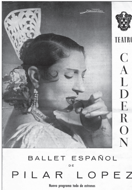
■ Programa de presentación del ballet de Pilar López.

Canales, y podemos disfrutar de verdaderos «ángeles diabólicos» como Cristina Hoyos, Eva Yerbabuena o Belén Maya, entre otros contados privilegios escénicos.