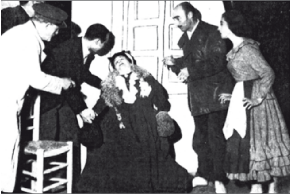
■ Escena de l'obra El señor Bob'le , de Schehadé, dirigit per Trino Martínez Trives.

El señor Bob'le es nada más y nada menos que la obra de un poeta. El escenario es —debería serlo con más frecuencia— la auténtica tribuna de los poetas. No hay posibilidad de renovación teatral si no nos acompañan los poetas. Pero ¿qué es El señor Bob'le ? ¿Un drama? ¿Una comedia de humor? ¿Una farsa? Yo creo que los términos —los límites— han quedado sobrepasados por la «obra». El señor Bob'le es una obra de imaginación que no es de desdeñar en nuestros escenarios. Por eso me decidí a traducirla y a montarla, con las grandes dificultades que la pieza entraña. Por eso y por la actualidad de Schehadé, como autor dramático, representado esta temporada por la compañía de Jean-Louis Barrault en los principales teatros europeos.