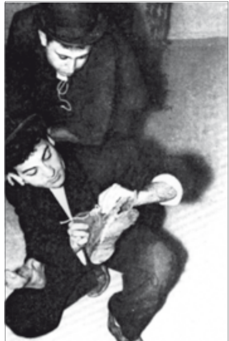
■ Escena de l'obra Esperando a Godot , de Samuel Beckett. ( Primer Acto , n. 1, abril del 1957, p. 20.

MARTÍN BERMÚDEZ, Santiago. «El año en que se publicó El teatro del absurdo de Martin Esslin». En: Las Puertas del Drama , n. (-1). AAT. Madrid: verano de 1999.