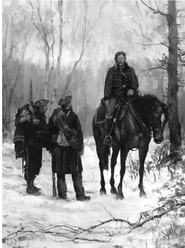
Francesc Savalls. Quadre d'August Ferrer Dalmau. (Procedència: < http://aspa.mforos.com >)

hasta los oídos del enemigo que, en su furioso despacho, les dirigía entonces los insultos más groseros. Todas las puertas estaban abiertas para estas heroínas de la caridad y del amor patrio, considerándose dichosos cuantos podían poner en sus manos un donativo para los combatientes. Casi solas acarrearón las mujeres todo el material de las barricadas que en varios puntos de la población se levantaron, y, sin distinción de clases, porfiaban en cuál podría prestar más servicios para salvar de la desolación que la amenazaba, a la Villa, objeto de su amor. 16