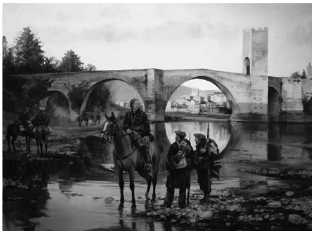
El general Savalls al pont de Besalú (Girona). Quadre d'August Ferrer Dalmau.

de la província. Per la defensa dels dies Dijous i Divendres Sant de 1873, la vila va rebre multitud d'entusiastes congratulacions «prueba de que la Nación aplaudía su generosa resolución y agradecía sus sacrificios, y de que no había sido infundada la creencia de que su triunfo o su desgracia pudiera influir algo en la marcha de la guerra civil en Cataluña». A més el lema fou: