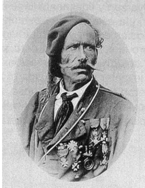
Francesc Savalls i Massot.

hora de destrucció.» Es varen trobar en molts horts llaunes plenes «de este terrorífico comestible, que ha venido a ser el elemento principal con que cuentan los redentores de la sociedad para llevar a buen término sus valerosas hazañas». Encara que els carlins també van comptar amb «colosales hachas y descomunales navajas que se han recogido junto a algunos cadáveres».