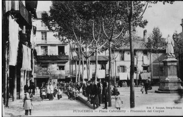
Plaça Cabrinetty. Processó del Corpus.

Debieron éstos causarles grandísimo daño, a juzgar por las espantosas manchas de sangre que en los suelos y camas de aquella casa se encontraron. Pero desde sus ventanas y de los agujeros que abrieron, contestaban con igual acierto, haciendo penetrar no pocas balas por nuestras aspilleras.