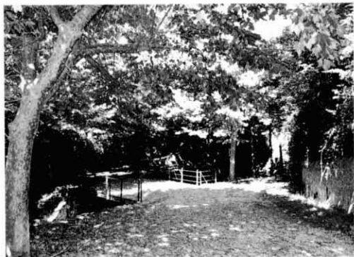
Estat actual de la font i el seu entorn.

Diu que la seva olor, característica de les fonts sulfuroses, -que recorda la sentor d'ous podrits- es podia arribar a detectar passant per la carretera, des del pont del Roser i sempre, en arribar al pont de la Puda ja se sentia sobradament; ara sols es capta quan s'és davant de la font. Les anàlisis de l'aigua donen repetidament que és potable, potser perquè algunes de les substàncies que conté hi fan l'efecte d'un desinfectant.