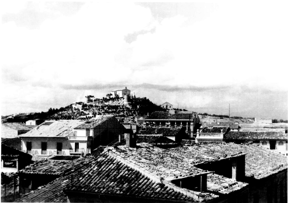
Vista parcial de la Serra de Sant Eloi a principis dels anys trenta. Es comença a intuir el que serà el parc actual.