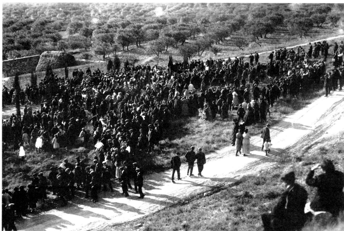
Vista general d'una Festa de l'Arbre a Sant Eloi, a començaments de segle. (CP: Família Saula-Briansó).