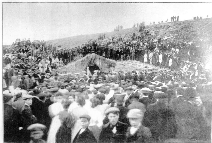
ASPECTE DEL POBLE A LA MONTANYA DE SANT ELOY, DURANT LA INAUGURACIÓ DE LA FONT

UNA vegada més la mer-itíssima Federació Agrícola Catalana Balear se ha reunit, aquesta vegada a la ciutat de Tàrrega, pera discutir temes d'interès per la classe agrícola. Ab tal motiu, la simpàtica població s'ha guarnit de festa y ha procurat obscurar als il·lust-rats congressistes que l'han visitada ab tota mena de complasencies, fins al punt de commemorar aquesta data ab la inauguració d'una font qu'anomenen del «Congrés», al turó de Sant Eloy, festa que va congregat en dit lloch a una gran gentada qu'aplau-dí frenèticament l'acte inau-gural y l'hermós himne, can-tat per un cor de noys, de-dicat als congressistes. Re-sultà una nota sumament pintoresca y animada que re-cordaràn ab goig tots los as-sistents.