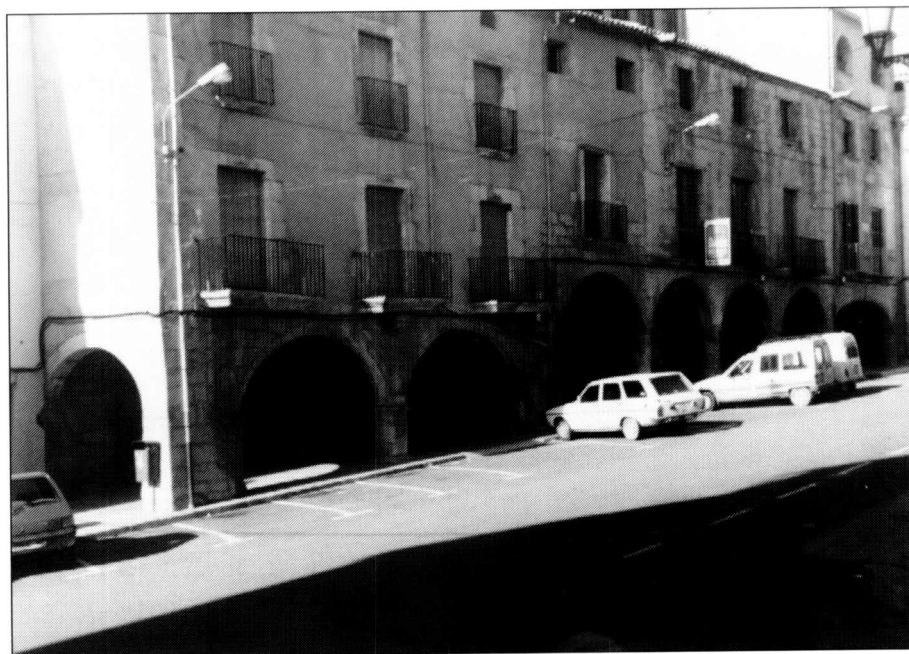
Cal Pogrés i Restaurant Casal. Edificis i llocs on es va fer teatre abans del 1912. Posteriorment n'hi feren els de la Santa Creu. Finalment, el Casal Parroquial, any 1959. Carrer Homenatge a la Vella. (Fotografia: J. Torres).

El 23 de maig de 1922, primer dia de fira, a la nit, tenen lloc les actuacions al teatre de La Unió, i tornen a actuar per la Festa Major. No es troba documentació de cap activitat el 1923. El 15 d'agost de 1924, a la Societat, el quadre de nens de l'Escola Nacional posà en escena la comèdia Un embus-