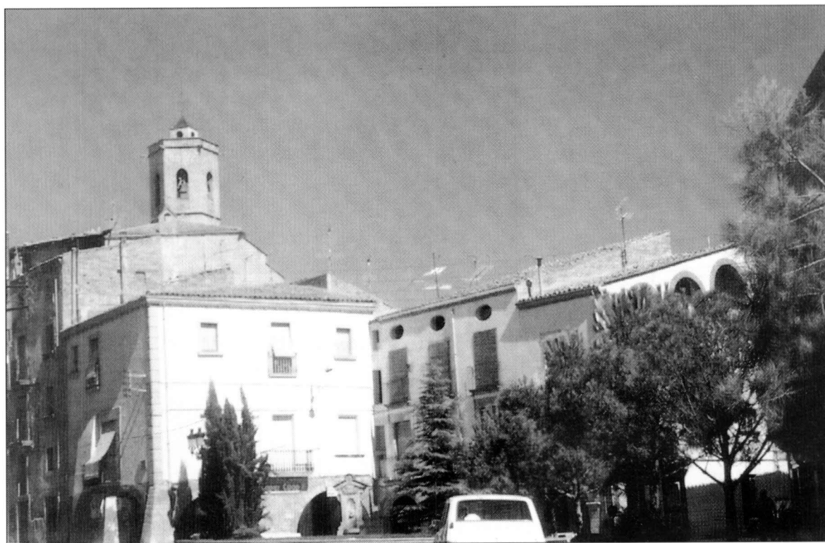
Cal Fortuny. El Suís, edifici on es fan representacions teatrals del 1922 al 1932. Plaça de Sant Roc.

Aquest es fa a la plaça Ramon Folch de Cardona, dita popularment el Parc. S'estrena per la Festa Major de 1945 amb varietats i una sarsuela. Per la Festa Major de 1946 es representen les obres Terra baixa , d'Àngel Guimerà, per la Companyia Enric Borràs, i Lo ferrer de tall , de Frederic Soler