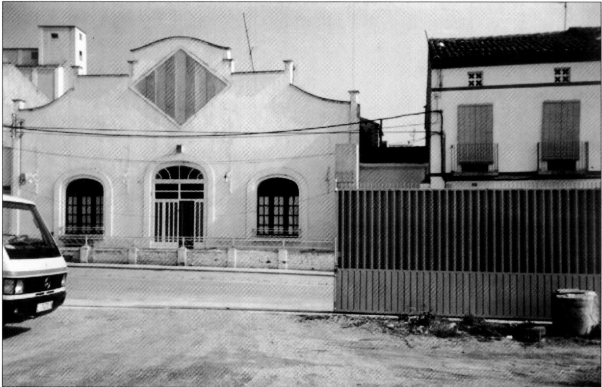
La Fontana. Antic edifici: Ateneu Prat de la Riba. S'hi va fer teatre el 1935, el 1963, i tornà a fer-se'n-hi el 1976-85. Carrer de la Font.

de teatre cito la del 30 d'octubre de 1923, No's pot ser pobre i Una cova de lladres . El dia 16 de novembre de 1924, l'obra Com les olives i Un viatge a Barcelona ; el quadre local del Sindicat posà en escena El paralític , La mort de l'avi i El cascabell . El 14 de desembre, les obres Fratricitat i la comèdia Toreros de pega . Pel Nadal de 1924, Els Pastorets , i per Reis de 1925, el drama Com les olives . El 2 de febrer de 1925 representen Noble venjança (drama) i la sarsuela Els dos didots . El 2 de març, Mar i cel , per un grup d'aficionats de Lleida. El 19 d'abril de 1925, El misteri del bosc . I per Tots Sants, Viatge de bodes . El 15 de novembre, Incapacitat . Per les festes de Nadal, Els Pastorets . El 2 de febrer de 1926, les obres Cebes al cap , Cria corps , i la sarsuela El contrabando . Per la Festa Major no consta el títol de l'obra representada. I per les festes de Nadal, El captaire , obra de Ramon Saladrígues, a més de Jugar a casats i El carro de vi . L'any 1927 desapareixen les seves actuacions teatrals.