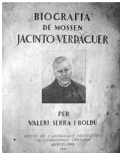
Coberta de la biografia sobre Verdaguer que féu per a l'Associació Protectora de l'Ensenyança Catalana (Barcelona, 1924).