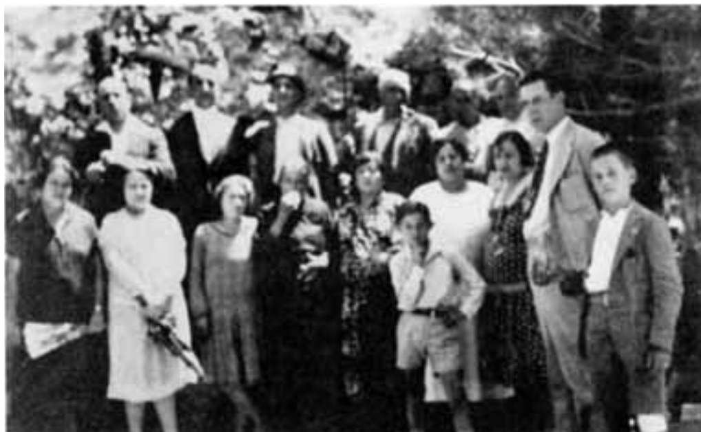
Fotografia de la família Serra i amics, al jardí de la casa de Bellpuig (decenni dels anys vint). AMB. LFVSB.

venderlo. Ahora, con la mentada declaración, será ya imposible que pueda ser llevada al extranjero joya artística de tan subido mérito.