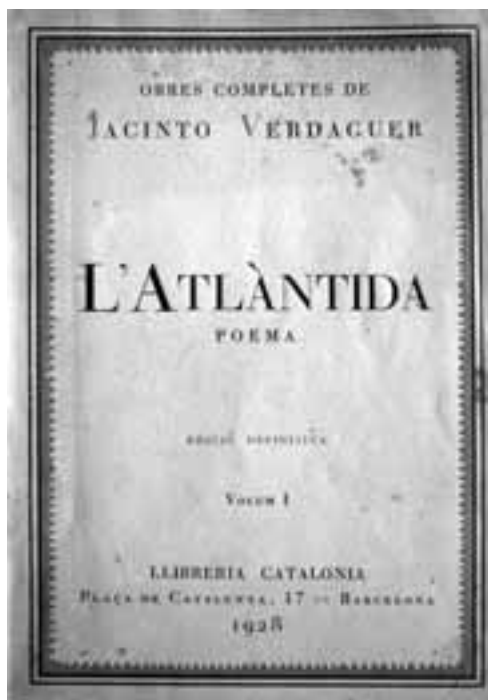
Coberta del primer volum de l'edició en rústica de les Obras Completas de Verdaguer a càrrec de la Llibreria Catalònia (Barcelona, 1928).