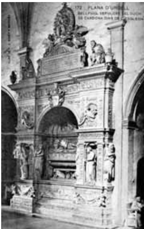
Tarja postal del sepulcre de Ramon de Cardona editada per l'Associació Protectora de l'Ensenyança Catalana. (Foto Samsot-Missé germans. Barcelona).

I no és fins que ja el sepulcre ha estat declarat monument nacional, que torna a sortir-ne informació al diari, justament per donar a conèixer aquest fet. Així, en un apartat de noticiari surt la informació encapçalada amb