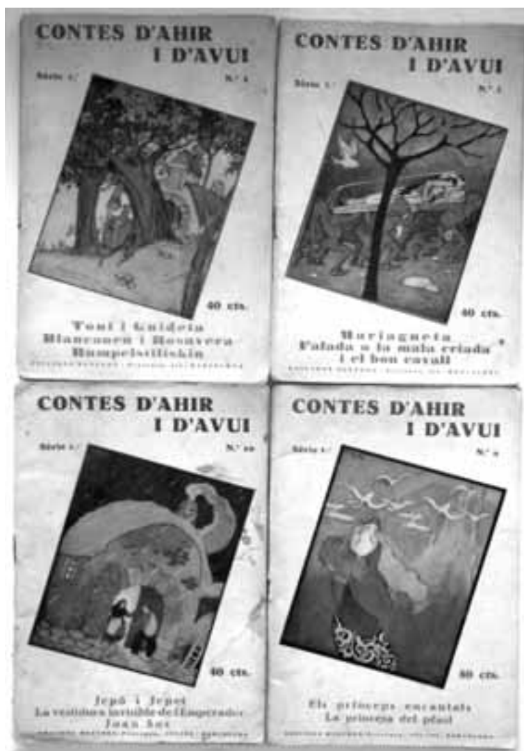
Quatre exemplars diferents de la col·lecció Contes d'ahir i d'avui que Valeri Serra publicà a les edicions Mentora, Barcelona.

Quant a les activitats de conferenciant, consta una conferència a Igualada, al Saló de la Casa de Cultura de la Caixa de Pensions, en ocasió de l'obertura del concurs-oposició de fotografia de l'Aplec de la Sardana (LV, 18.04.1929, 29 se'n fa avís, i 27.04.1929, 31 es recorda que es farà l'endemà). També una altra conferència, a Artés, al Sindicat Agrícola, dins l'activitat de l'Escola Superior d'Agricultura (05.05.1929, 14); sembla, per una notícia posterior, que la conferència de Serra i Boldú tingué com a assumpte l'organització agrària (LV, 18.07.1929, 10).