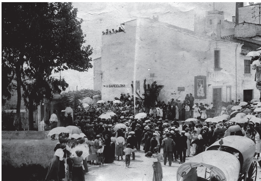
Arribada de l'aigua corrent a Canet de Mar.