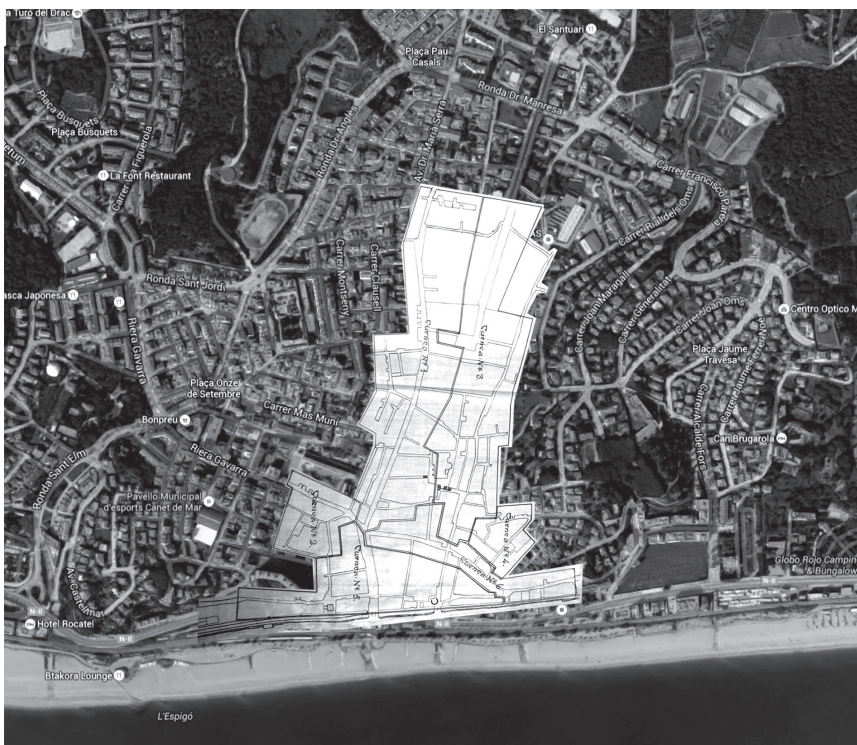
Detall del projecte de clavegueram de Canet de Mar

Es de creure que serán molts més que'ls imitarán, donant aixís una prova de bons canetenchs, per la confiança que demostran tenir en l'important millora». 33