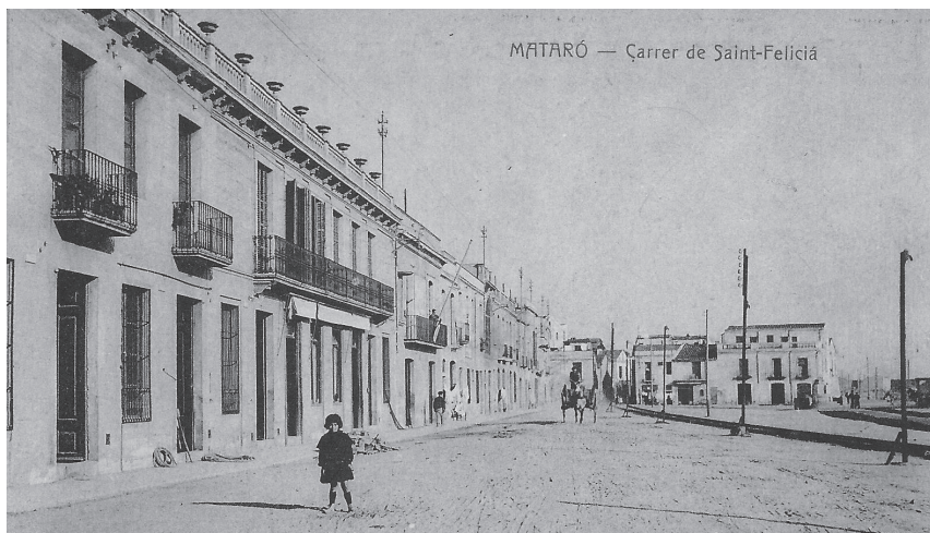
Vista del carrer de Sant Felicià. Al fons a la dreta s'aprecia com era l'edifici de Can Maitanquis a principis de segle, abans de la reforma que el faria pujar una planta més. Hi observem tres grans portals, tres balcons i una terrassa amb golfa a la part del darrera.

La façana del carrer de Sant Onofre tenia una porta d'entrada a l'establiment i dues finestres a la planta baixa, mentre que als pisos superiors hi havia quatre portes amb