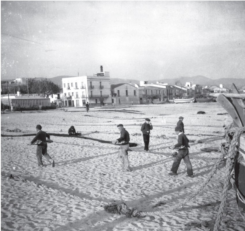
Platja de Mataró al fons Can Mitanquis. Ref. 62280.

La paret de can Mitanquis fou l'àgora o el fòrum de la gent de mar. Era un bar a la moda vella, on no s'hi coneixia l'hora de tancar, com passava també amb els pescadors que per ells el temps no comptava. Una llarga paret emblanquinada de calç, amb una faixa de blau en tot el seu llarg, ben abrigada del vent del nord i de cara a l'horitzó, era el lloc de trobada dels pescaires. Si ella hagués pogut parlar abans d'enderrocar-la, fóra tot un context d'etnografia i folklore de la gent de mar que s'hauria pogut relligar. En ella s'hi havia parlat de la Guerra de Cuba i dels viatges dels bergantins goletes de les drassanes de Mataró o de Vilassar, del transport de tomàquets de Canàries amb l'anècdota del "Metge que ve de fora", i també de la tràgica nit de l'"any de la galerna".