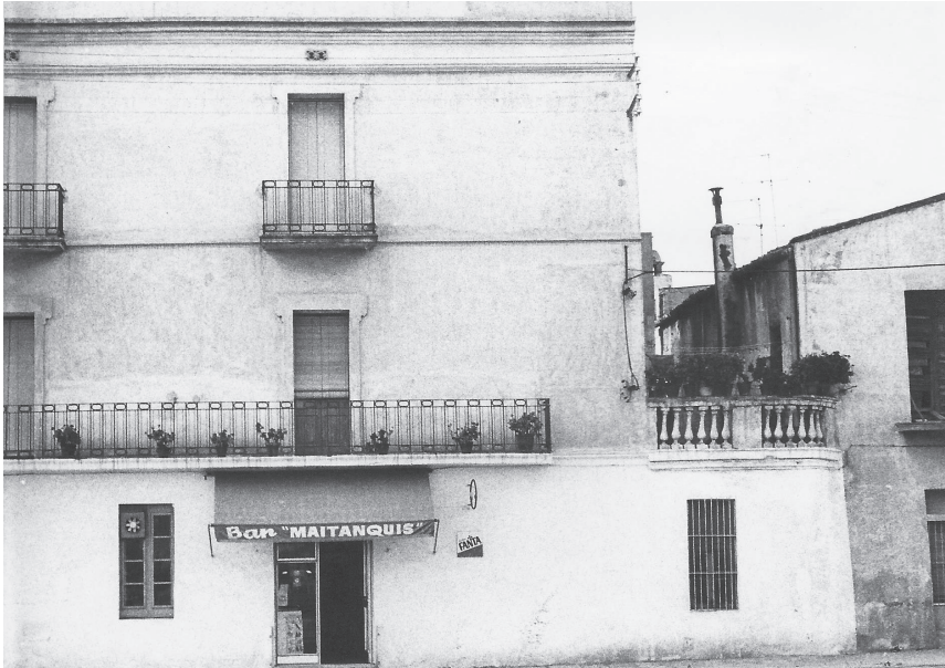
Façana de can Maitanquis que donava al carrer de Sant Onofre. Anys setanta del segle XX.