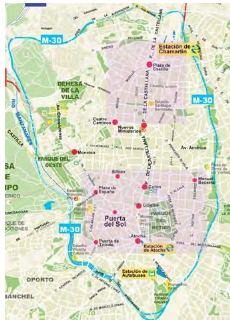
Figura 2. Trazados de la M-30

Fuente: http://www.softguides.com/madrid_guide/maps/graphics/zoom_m30.jpg