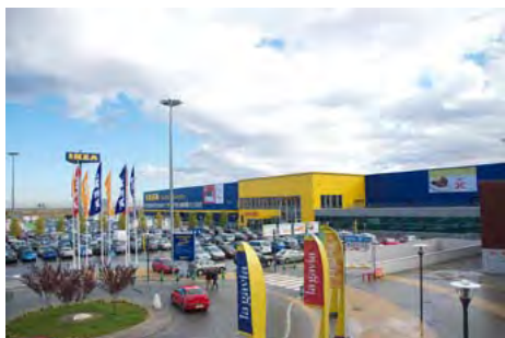
Figura 9. Imágenes del centro comercial La Gavia (ensanche de Vallecas) y de una calle de Valdebernardo