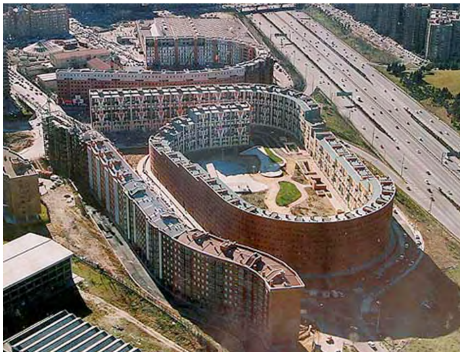
Figura 5. Edificio El Ruedo de Sainz de Oíza, al este de la M-30, en el límite de Moratalaz