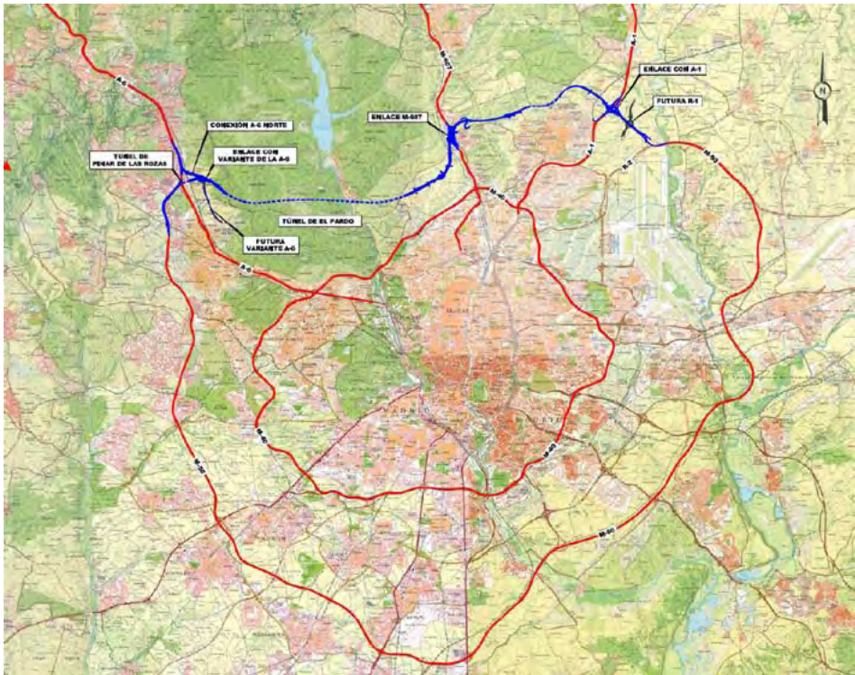
Figura 6. Trazados de la M-40, M-45 y M-50