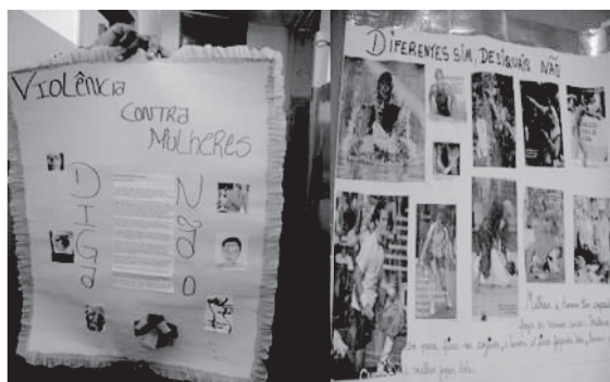
Figura 4. Cartells de la campanya contra la desigualtat i la violència de gènere

El segon projecte, la investigació duta a terme pels estudiants per identificar situacions de desigualtat i de violència en els conflictes de gènere viscuts per aquesta comunitat, també va tenir com a punt de partida els conflictes relatats pels estudiants. Es va fer així perquè, en reflexionar sobre ells mateixos, un grup d'estudiants va suggerir escoltar les persones del barri (els seus pares i parents) amb l'objectiu de tenir informació més precisa sobre la realitat del barri. Amb l'orientació d'una professora i ajudats per materials que van obtenir a través d'investigacions bibliogràfiques, els estudiants van elaborar una guia per a entrevistes i van sortir als carrers del barri a entrevistar dones i homes. A continuació presentem quatre treballs dels estudiants: els dos primers són fruit d'anàlisis fetes a partir dels informes obtinguts a través de les entrevistes (que van ser exposats al mural de l'escola); els dos últims són cartells que es van fer i utilitzar durant la campanya dels estudiants, a l'escola i al barri, contra la desigualtat i la violència de gènere.