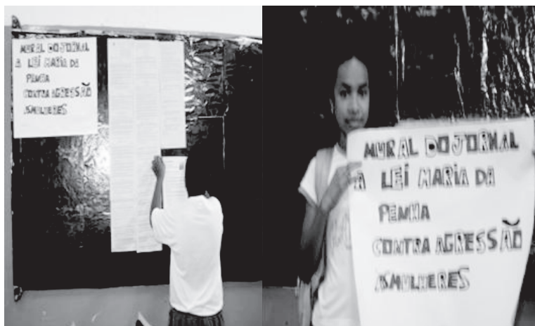
Figura 1. Alumnes exposant treballs sobre la Llei Maria da Penha contra l'agressió a les dones al diari mural

Des d'aquell moment, quan es van adonar —i es van sorprendre— de l'índex de violència (física i psíquica) soferta per les dones de la comunitat, van començar a qüestionar-se sobre les condicions de vida d'aquestes dones i sobre la manera com el govern podria intervenir en aquesta situació. Per tal que l'alumnat conegués de manera més profunda la temàtica, la professora els va incentivar a fer una investigació per extreure informació d'Internet i d'altres fonts. Amb l'ajuda del material trobat, es van promoure debats i reflexions sobre el tema, i quan els estudiants van entendre la Llei Maria da Penha, van decidir dedicar una edició del diari mural de l'escola a aquesta llei amb la intenció que totes les persones que anaven al centre la coneguessin. A la figura es mostren alguns treballs que van ser part del diari mural.