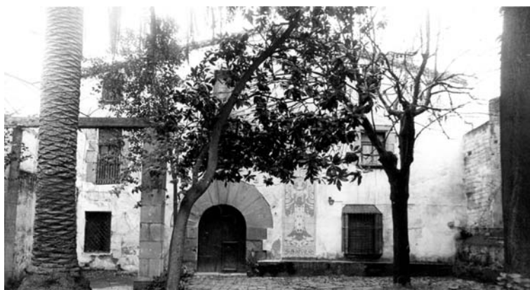
Façana de la masia Rocosa, als anys 70 i a baix, secció feta per Lluís Bonet i Garí.

L'Exposició Universal de Barcelona de 1888 va acabar de consolidar Lluís Domènech i Montaner com un professional de prestigi. El 30 de juny de 1887 l'arquitecte va ser nomenat director de la secció cinquena de les obres del certamen i, des d'aquest càrrec, tindrà l'oportunitat de demostrar amb escreix tot allò que proposava l'any 1878 en el seu article En busca d'una arquitectura nacional . Domènech projectarà alguns dels edificis més destacats de l'Exposició, com el Gran Hotel Internacional, el Cafè-Restaurant del Parc de la Ciutadella i també la reforma de l'Ajuntament de la ciutat. Per tant, a partir d'aquell moment, es va centrar exclusivament a desenvolupar aquests treballs i, arran d'això, va decidir traslladar-se a Canet, a can Rocosa, una masia del segle XVII on des de 1875 Domènech hi passava les temporades d'estiu amb la seva esposa i els seus primers fills. Per poder combinar la activitat arquitectònica amb les atencions a la seva família, Domènech va eixamplar la propietat i va adquirir, anys abans, una casa de poble situada al