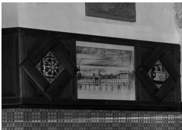
Despatx de la masia Rocosa, amb la taula de treball, llibreria i llar de foc dissenyada per Lluís Domènech i Montaner