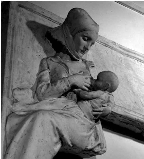
Guix d'Eusebi Arnau que es pot veure a l'interior de la masia Rocosa i a la dreta, el treball quan es va publicar a Garba