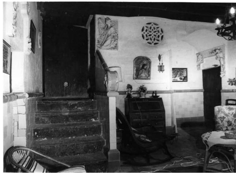
Entrada de la masia Rocosa. Es pot veure l'espiell barroc i els diferents elements modernistes que Domènech integrà el 1905

Domènech també va decorar totes les llindes de les obertures interiors de can Rocosa amb deu modelats