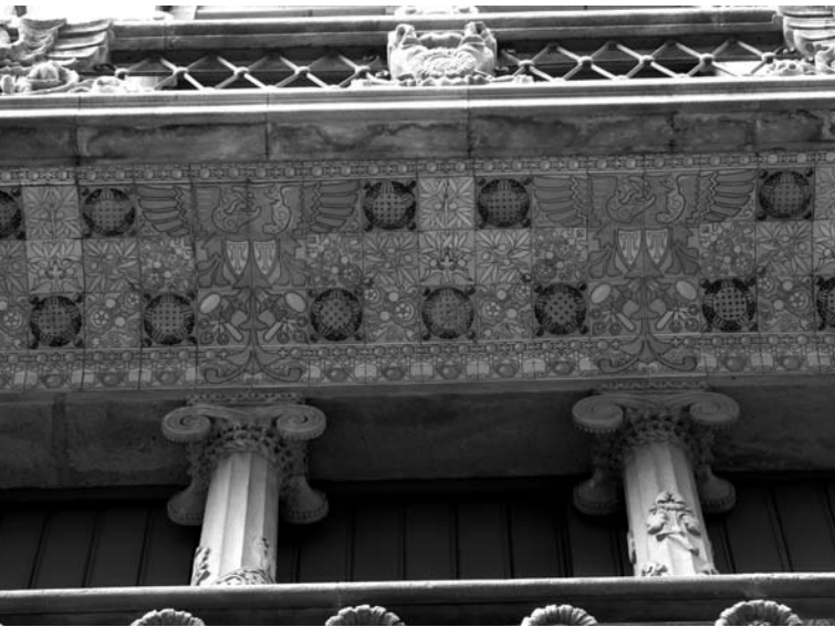
Mosaics de la Casa Thomas, que Domènech també integra darrera el rentamans de can Rocosa (2012)