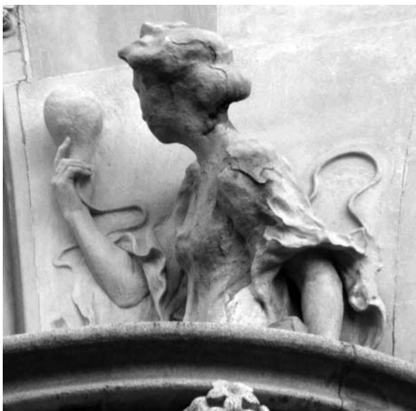
Escultura al·legòrica de la façana de la Casa Lleó Morera de Barcelona i a la dreta, el guix original, a la masia Rocosa

femenines basant-se amb els físics de les seves nètes. La façana de can Rocosa conserva encara avui tots els trets originals de la típica construcció del barroc. De fet, amb la reforma de 1905 Domènech va voler respectar fins i tot els esgrafiats que emmarcaven les obertures de les finestres i la porta de dovella, però va voler incorporar-hi un gran plafó ceràmic de més de tres metres d'alçada sota l'esgrafiament del rellotge de sol. Aquesta composició ceràmica és obra del mosaicista Lluís Bru i respon a la representació iconogràfica d'una figura angelical. És una prova ceràmica que Domènech va fer a la fàbrica Pujol i Bausis d'Esplugues de Llobregat per destinar-la a la