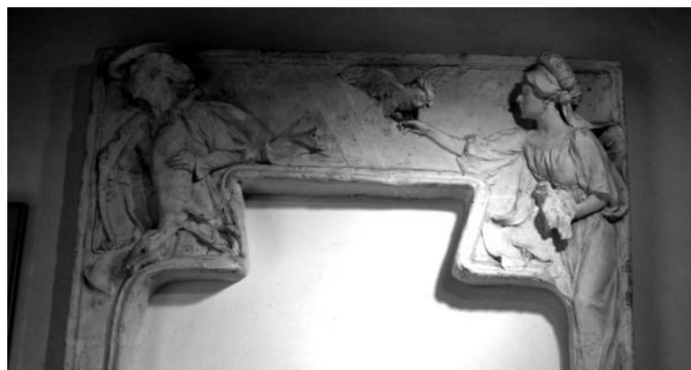
Llindes d'Eusebi Arnau, a la Casa Lleó Morera i diferents models dels guixos originals, a les obertures interiors de la masia Rocosa