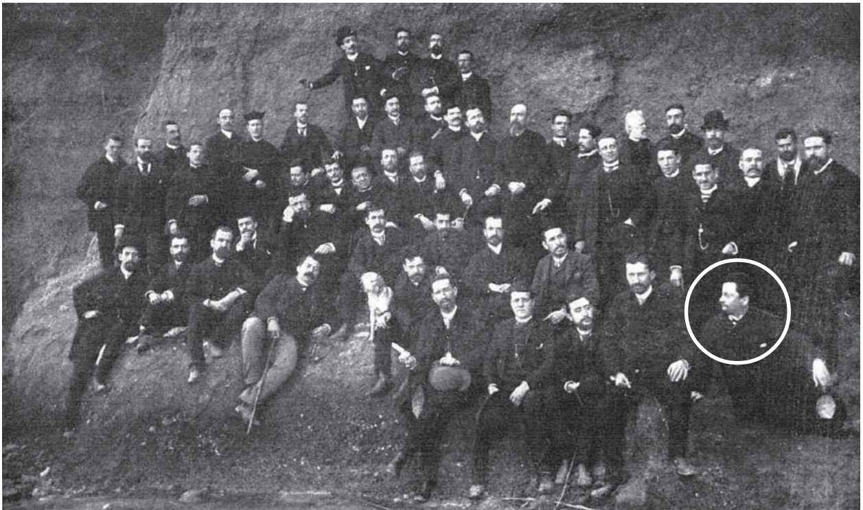
Els homes de La Renaixensa, en una festa literària de Sabadell, el 1888. El primer de la dreta és Lluís Domènech i Montaner.