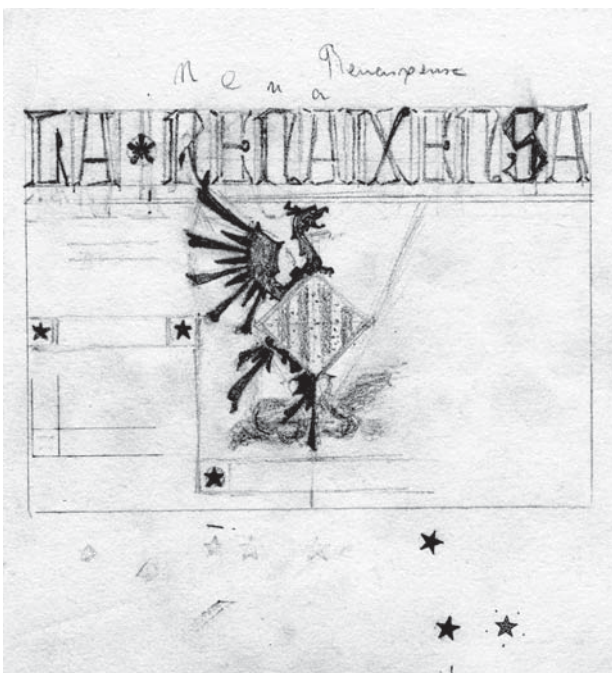
Esbós de la capçalera del diari catalanista La Renaixensa, dissenyada per Lluís Domènech i Montaner

diar i analitzar el passat medieval i prendre'l com a model. Mireu, quan Domènech va fer el monument d'Alselm Clavé va voler que hi aparegués la frase "De les lluites passades, del defalliment en què la postraren, s'alça Catalunya recuperada pel treball". I és cert. Domènech tenia clar que aquest renaixement cultural de Catalunya, que havia empès en el seu moment Clavé, només es podia continuar fent més treball pel país. Des de l'any 1869 ja el trobem com a membre de la Jove Catalunya, una associació d'evident inspiració mazziniana, molt similar a la