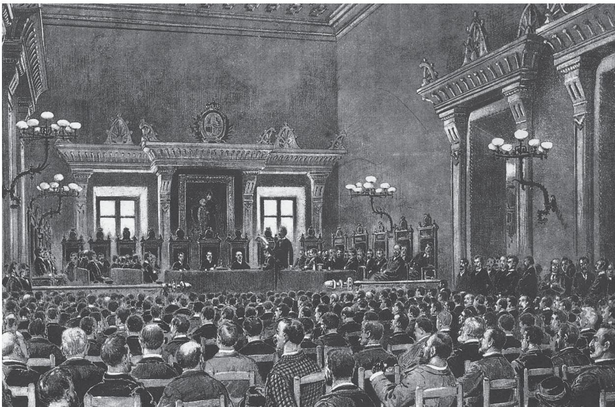
Les Bases de Manresa consoliden políticament Lluís Domènech i Montaner com l'home fort del catalanisme