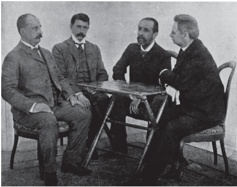
A dalt a l'esquerra. Candidatura dels Quatre Presidents. Sebastià Torres, Albert Rusiñol, Bartomeu Robert i Lluís Domènech i Montaner.