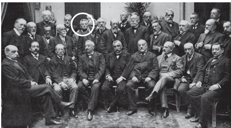
La Jove Catalunya, l'any 1883, quan vingueren a Canet i el 1909, en un homenatge a Àngel Guimerà. Amb un cercle, Lluís Domènech i Montaner.