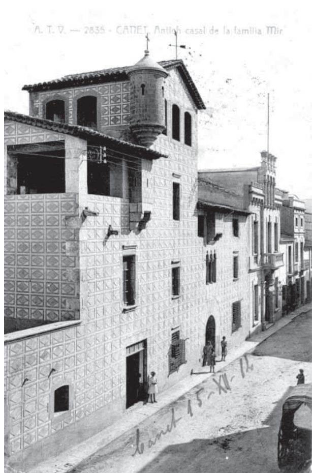
El Mas Cabanyes, reformat i ampliat per la família Mir (AMCNM)