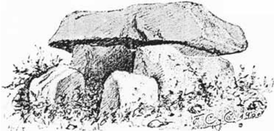
El sepulcre de Vilassar de Dalt, en una representació artística de principis del proppassat segle (CARRERAS Y CANDI 1903: 247). Permet apreciar la llosa del lateral sud del passadís que no apareix a la planta de Castells i VilardeLL. Aquest bloc va ser reposat amb posterioritat a la publicació de la planimetria ja esmentada, però, recentment, ha tornat a caure (per a més detalls, vegeu l'apartat «Estat de Conservació»).