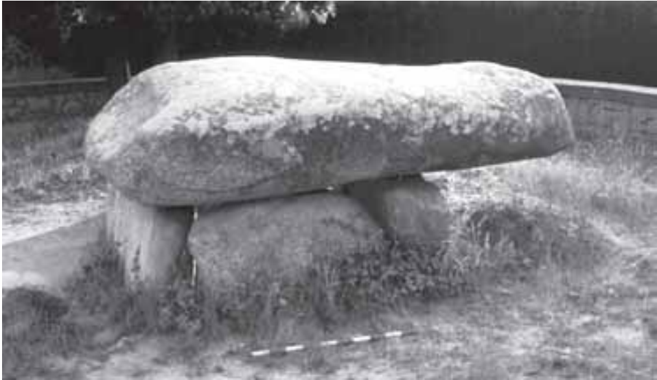
Dues imatges més del sepulcre megalític de Vilassar de Dalt. Superior: vista des del costat de llevant. Inferior: des del lateral nord.