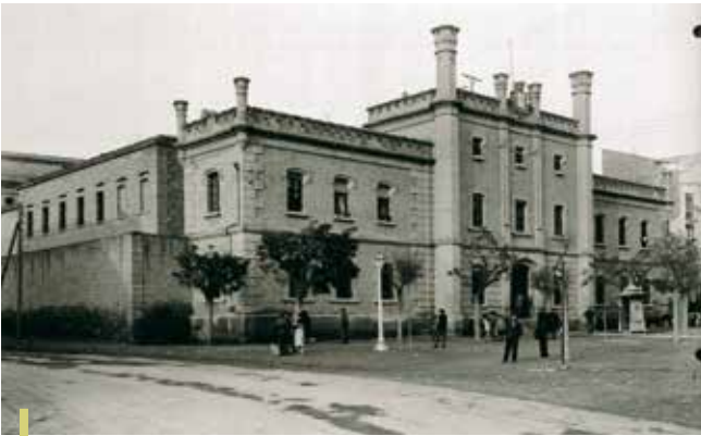
Fig. 5 - Antiga presó de Lleida.