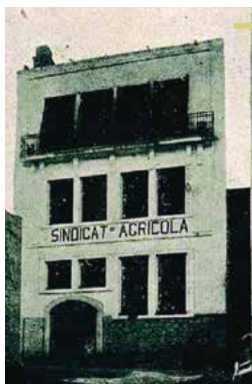
Fig. 3 - Façana Sindicat d'Artesa.

L'any 1922, després de cinc anys de funcionament, es dissolgué l'entitat. Moltes famílies d'Artesa, així com el seu president, van quedar totalment arruïnats (fig. 3).